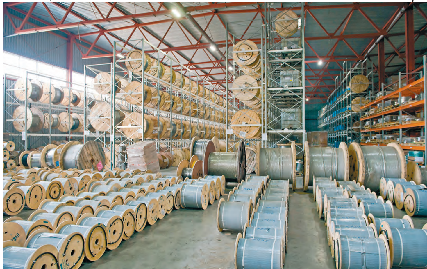
Компания «Инкаб», которая производит оптический кабель, — типичный пример импортозамещающего производства в Пермском крае