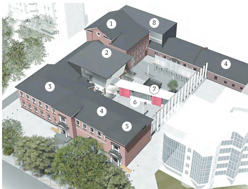
1 — большой зрительный зал; 2 — новый зал на 100 мест; 3 — музей кукол, лекционный зал; 4 — исторические здания пересыльной тюрьмы; 5 — кафе, кассы, сувенирный магазин; 6 — здесь были гаражи; 7 — трансформируемые конструкции; 8 — новый административный корпус

Гаражи и другие хозяйственные постройки, которые загромождают двор, будут снесены. Вместо них появится трансформируемая конструкция, которая будет менять конфигурацию в зависимости от времени года. Появятся два новых зала: стационарный на 100 мест и зал под открытым небом, плюсом к которому будет проекционная стена, на которой можно будет демонстрировать фильмы или видеодекорации. «Пол» двора будет покрыт специальным материалом — упругим, нескользким, не