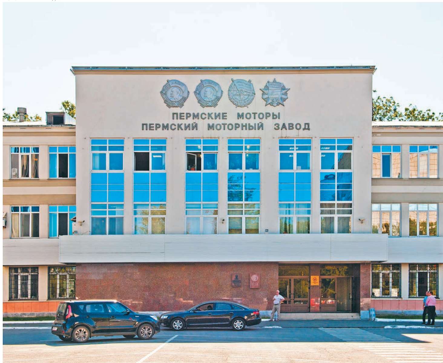
По финансовым показателям моторостроители за прошлый год немного «выросли», прибавив в выручке