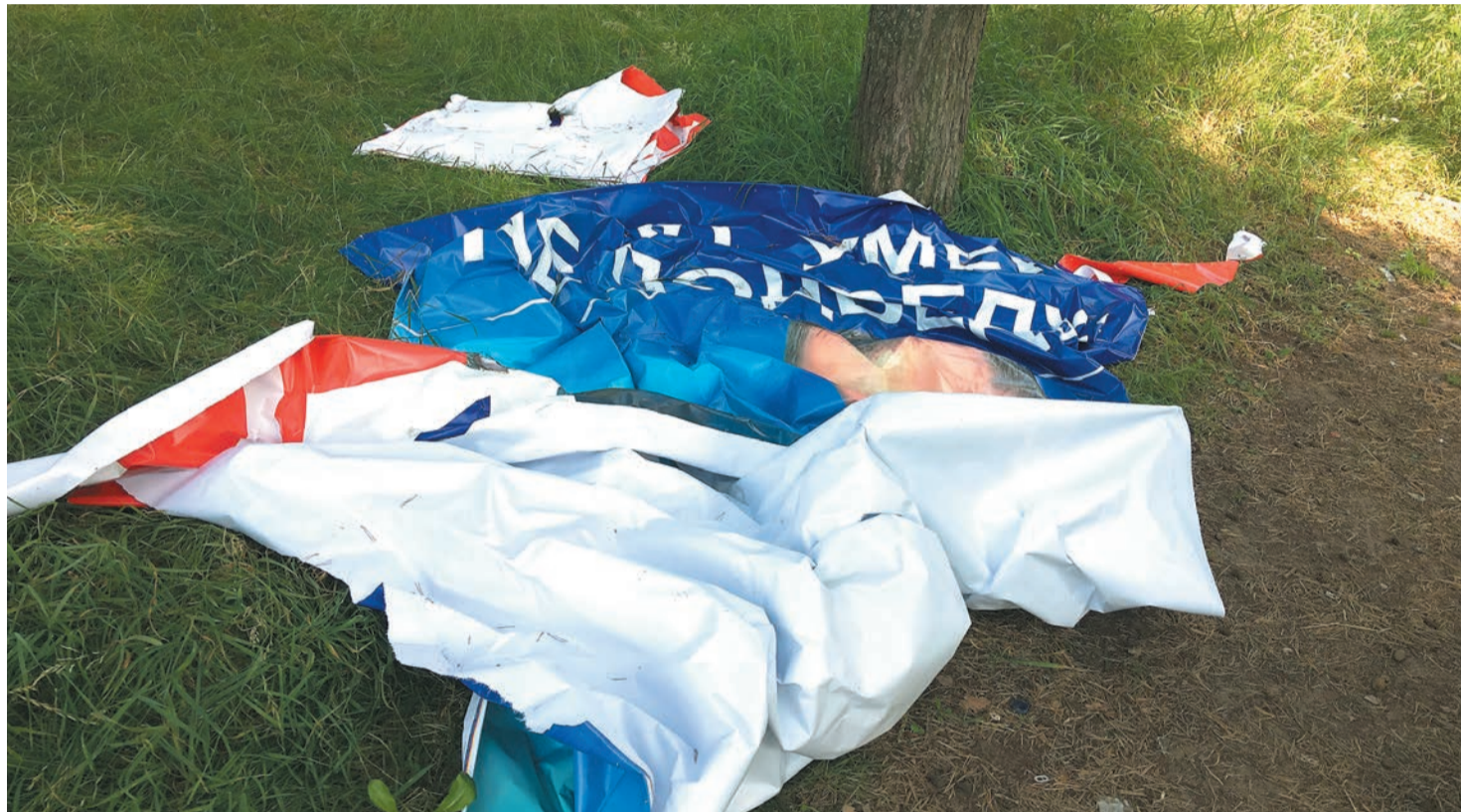
Суровые северные политтехнологии в Соликамске: массово регистрируются однофамильцы и срываются баннеры конкурентов