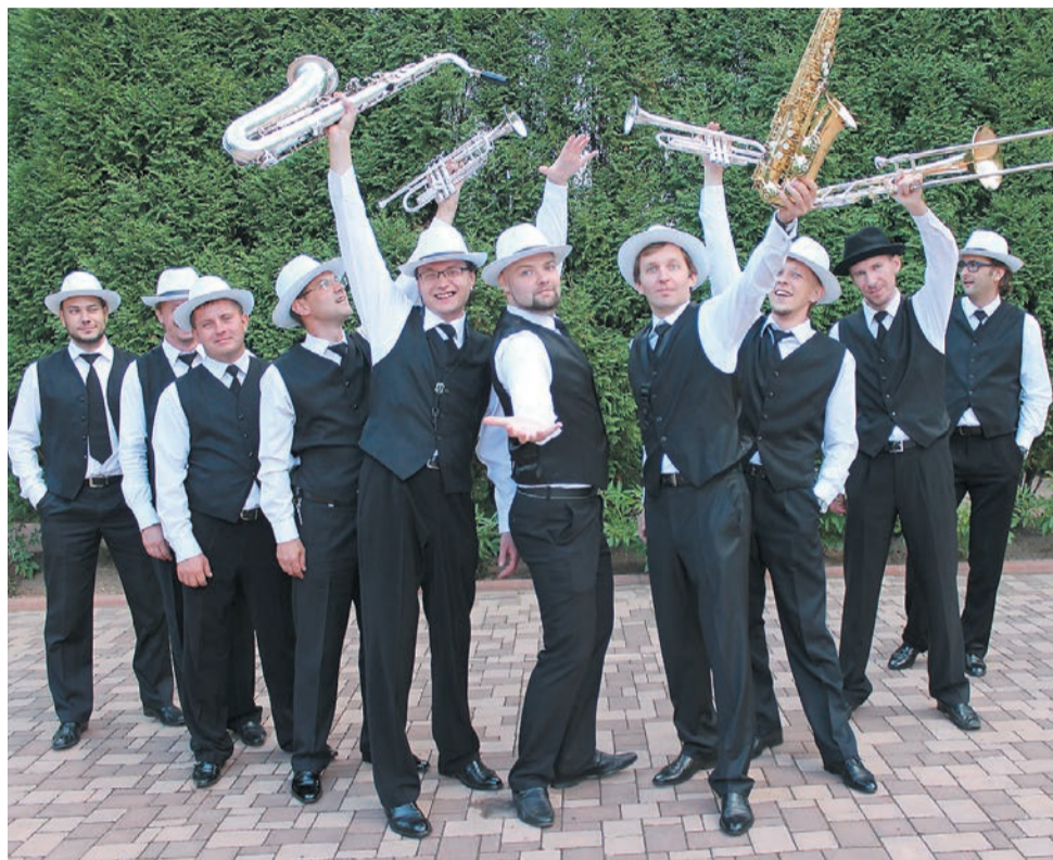
Chertkov Jazz Band