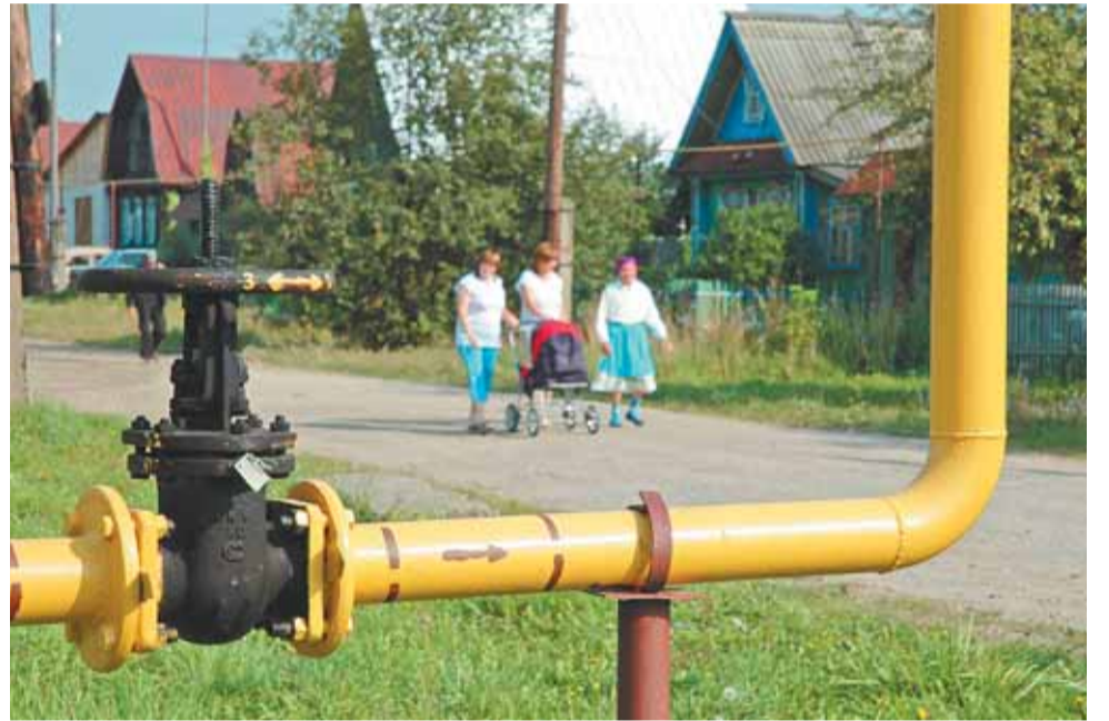
По уверениям министра соцразвития, подключиться к газу теперь будет проще

Параллельно велась работа с управляющими компаниями по ремонту общедомового имущества. В результате комиссией для устранения замечаний УК выдано более 120 предписаний.