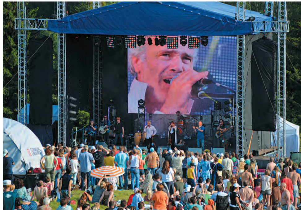
На сцене — ирландцы Kila