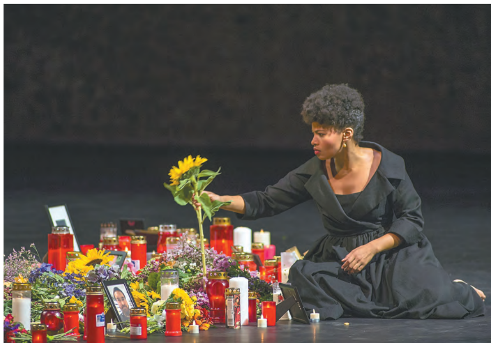
Вителлия (Голда Шульц) терзается раскаянием

Заглавный герой — римский император Тит Веспасиан (американский тенор