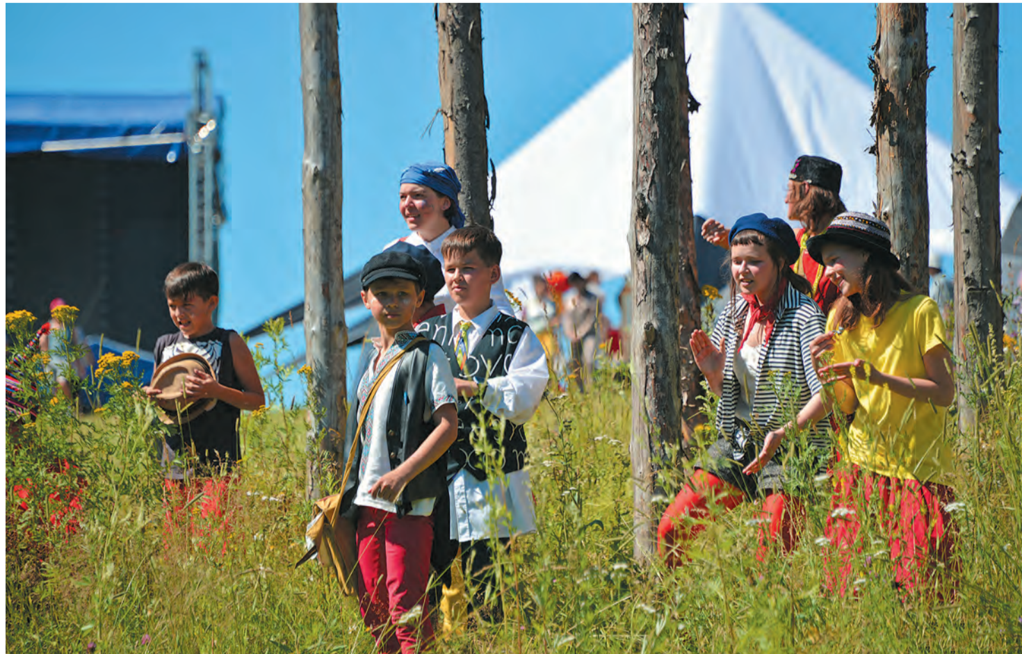
«Звенидень! Звенидень!» Перформанс «Дети Каменского»

Один из больших проектов «Камвы 2017», растянувшийся на два дня, — этнофутуристический перформанс «Птицы и люди», он же — «Люди и птицы» на второй день. Художник Юрий Лисовский придумал железных птиц, вдохновившись традиционными изображениями пермского звериного стиля и его символикой. Несколько железных каркасов были расставлены на площадке фестиваля, а зрителям предлагали обвязывать их ленточками, загадывая желания. Интересно, что ленточки делали из старой одежды, например, музыкантов, приехавших на «Камву», гостей, хозяев... Снятая с человеческого тела, она всё ещё хранит следы его прикосновений, духовную память о прошлом сосуществовании — ну да, всё ту же энергию. Это вам не стерильные магазинные ленты. Птицы — посланники верхнего, духовного мира, они летят в будущее, которое ответственно за «сбычу ваших мечт». Или несбычу. Тут важен урок второго дня перформанса, когда ленточками не обвязывали отдельных птиц, но соединяли их друг с другом, чтобы каждый из нас руками, умом, всей душой осознал всеобщую духовную связь и взаимную ответственность — за воплощение наших общих желаний.