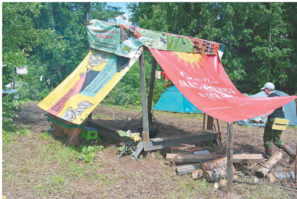
Полевая кухня экспедиции

Съёмки также пройдут в Перми, Кирове, Кемерово, Красноярске, на Дальнем Востоке и в Польше.