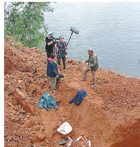
Параллельно с палеонтологами на месте раскопа работает съёмочная группа

Первая находка этого сезона — пластина зуба трогонтериевого слона. Слоны приспособились к холодному и сухому климату, к новой пище — травянистой и кустарниковой растительности, для чего им был необходим эффективный аппарат перетирания растительных волокон. Первые зубы прорезывались сразу после рождения, а каждый следующий — по мере изнашивания предыдущего. Поэтому, как отмечают учёные, количество пластин, из которых состоял зуб, у слонов увеличивалось.