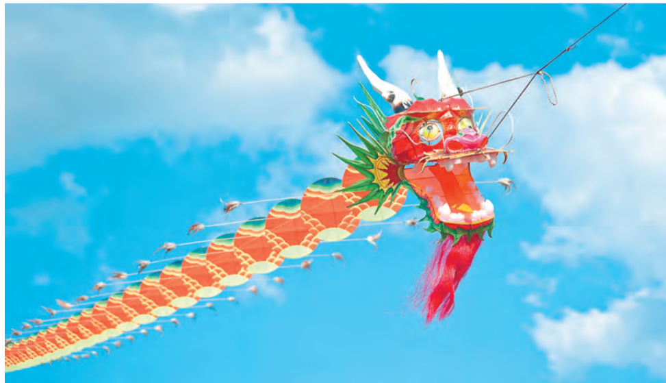
Фестиваль воздушных змеев

Программа фестиваля не исчерпывается новинками. Как всегда, будет Праздник нового хлеба, этнокино, грандиозная ярмарка «Город мастеров» и, конечно, музыка.