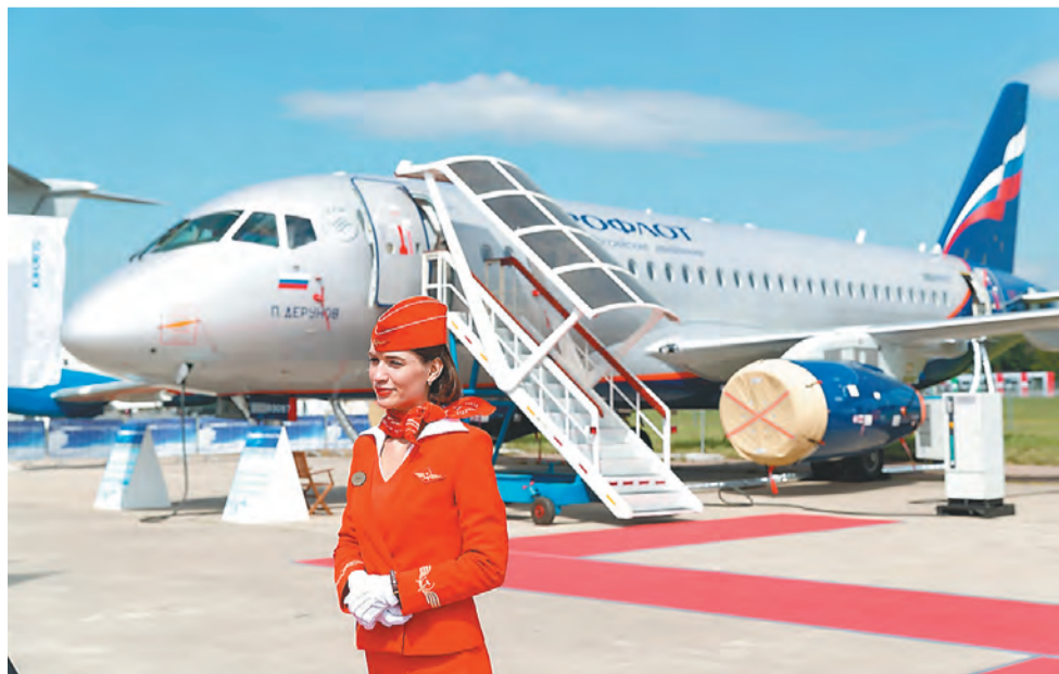
«Пермские моторы» обеспечены заказами на поставку двигателей для отечественной авиации

Добавим, что в Прикамье новые инвестпроекты реализуются не только в сфере ОПК, но и во всех ведущих отраслях промышленности. Общий объём инвестиций составляет порядка 500 млрд руб. Сегодня Пермский край всё чаще звучит в повестке федеральных СМИ, интерес к региону неуклонно растёт, причём в самых разных аспектах.