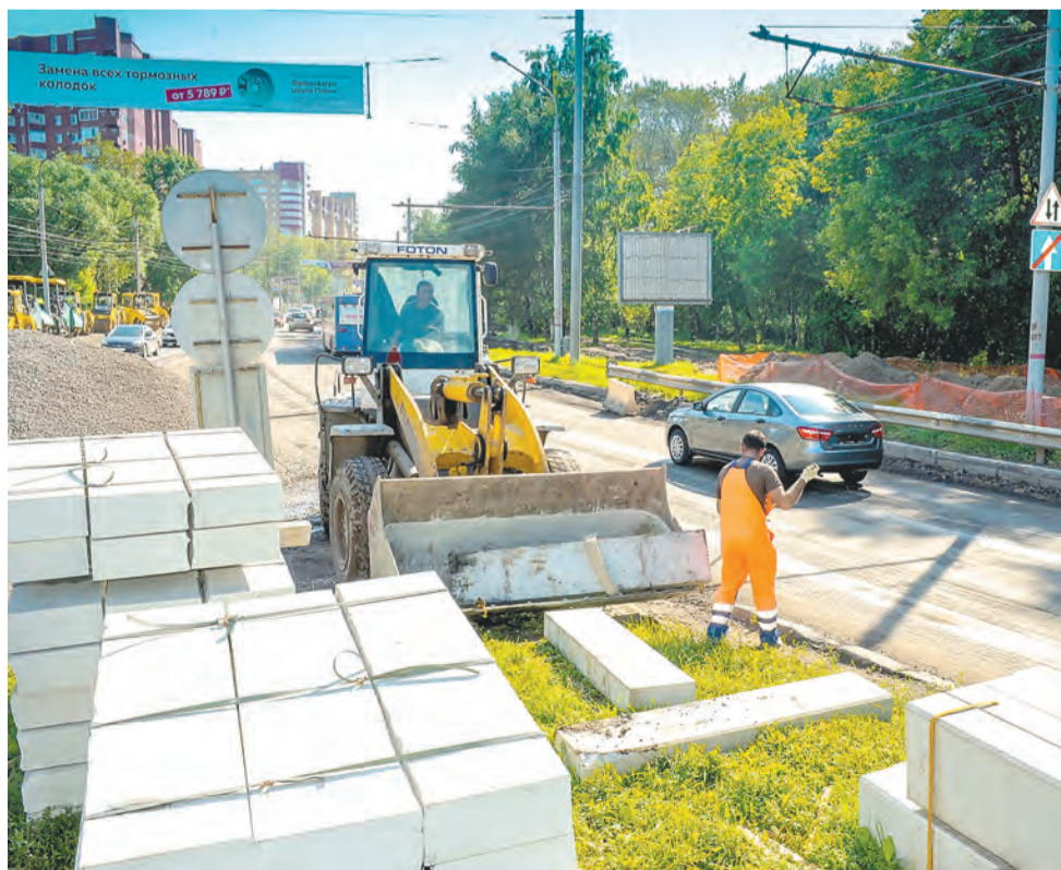
Идёт реконструкция шоссе Космонавтов

Теперь до такого же высокого уровня надо подтягивать и уровень городского комфорта, общественных пространств, сферы услуг и сервиса, переоценить подходы к градостроительной политике, найдя возможность для участия застройщиков в строительстве объектов социальной инфраструктуры. Краевая и городская власть уже на этом пути. Вы сами видите: идёт реконструкция набережной, достраивается аэропорт, начато строительство зоопарка, массово ремонтируются дворы, улично-дорожная сеть, реконструируются парки и скверы. В ближайшие четыре-пять лет качество городской среды в Перми кардинально изменится.