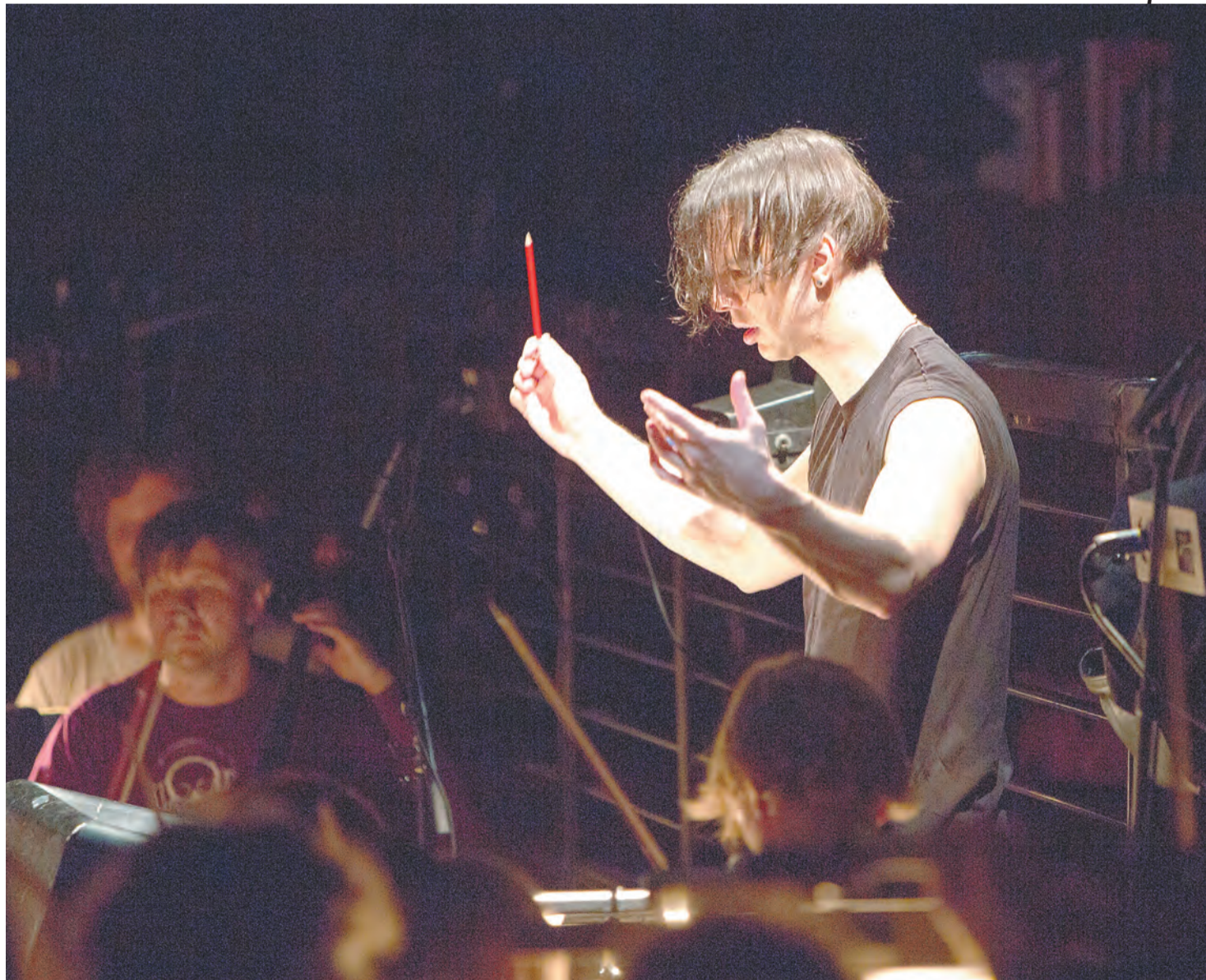
Идёт репетиция «Милосердия Тита»