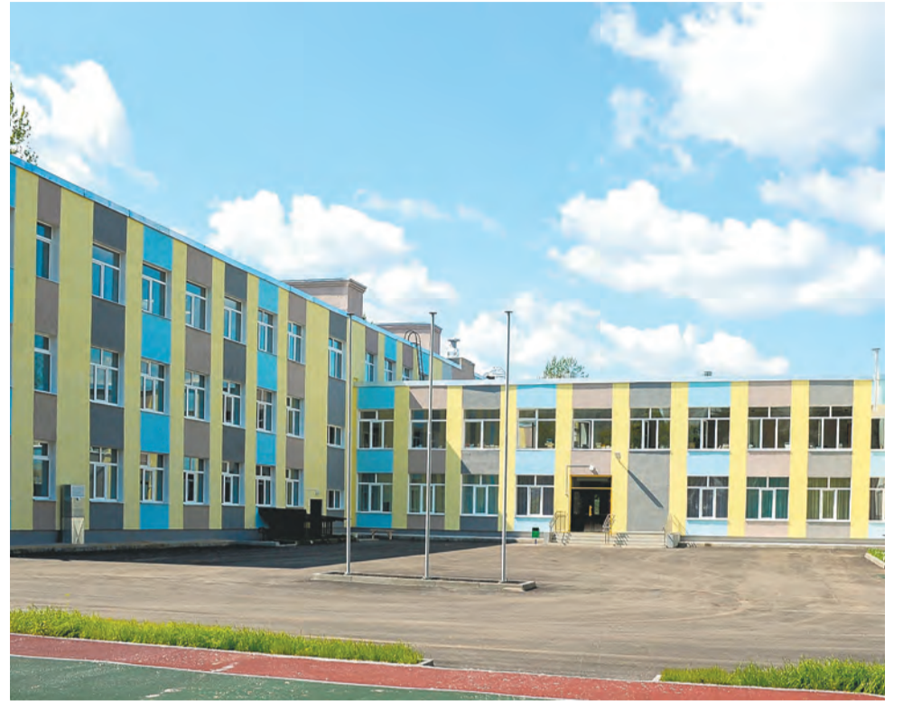
Завершается капитальный ремонт в школе №73 в Кировском районе Перми