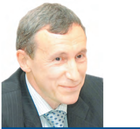
Андрей Климов, сенатор от Пермского края

Чем запомнился самый легендарный руководитель Прикамья?