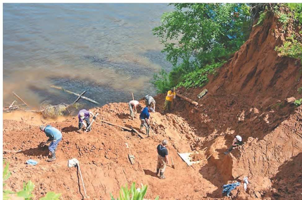
Работы на месте раскопа продолжаются независимо от погодных условий

«За зимний период мы открыли более 20 костей различных скелетов. Три кости — самые большие части тела: тазовая, плечевая и лопатки. Все кости, найденные во время экспедиции в 2016 году, отделены друг от друга, понятно, что все в разной степени