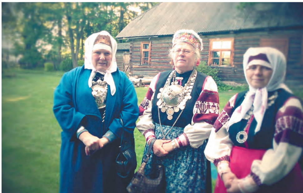
Obinitsa Seto Grupp

Где и когда выступят: музей «Хохловка», сцена у реки; 29 июля, 12:00.