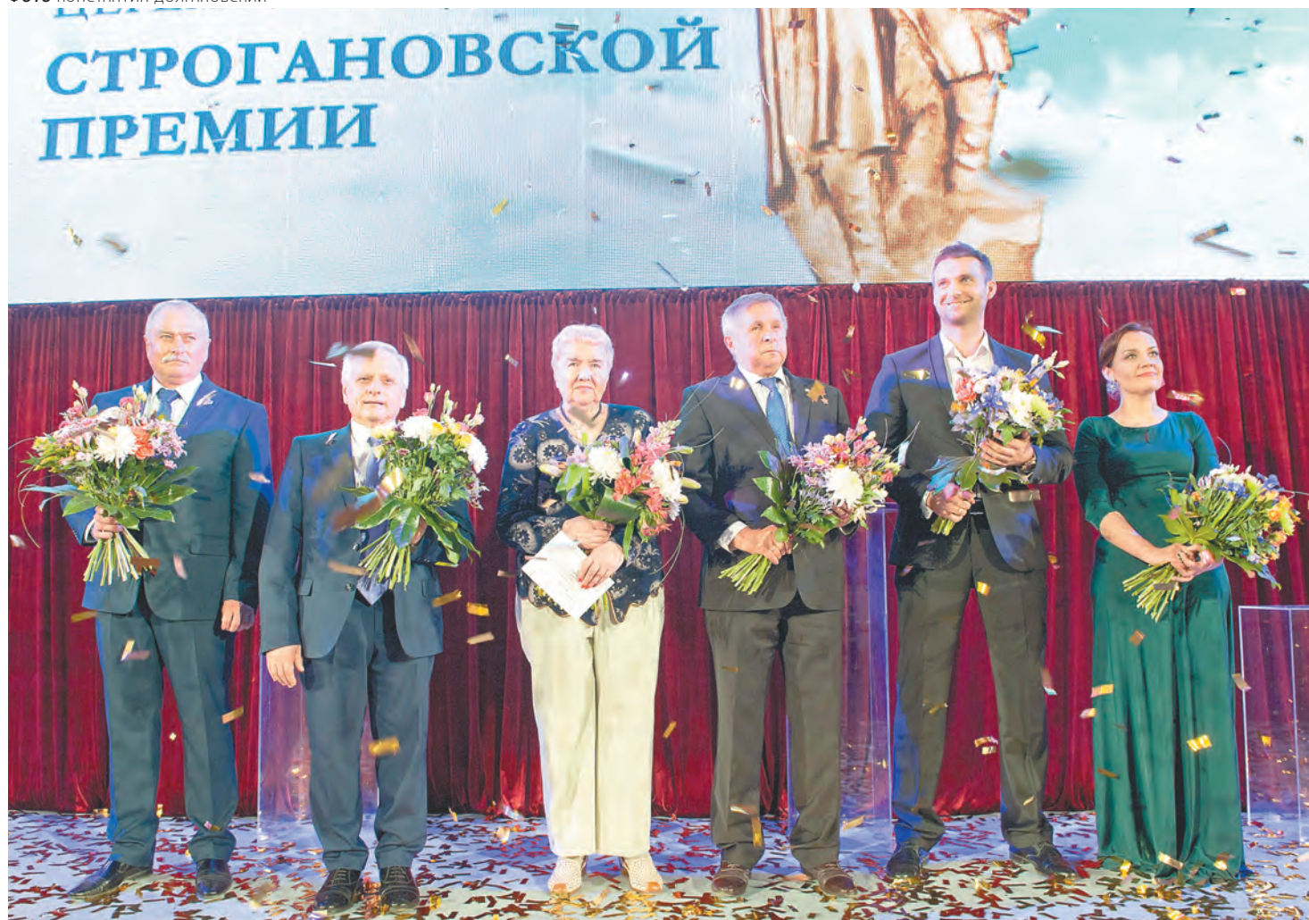
Лауреаты Строгановской премии — 2017