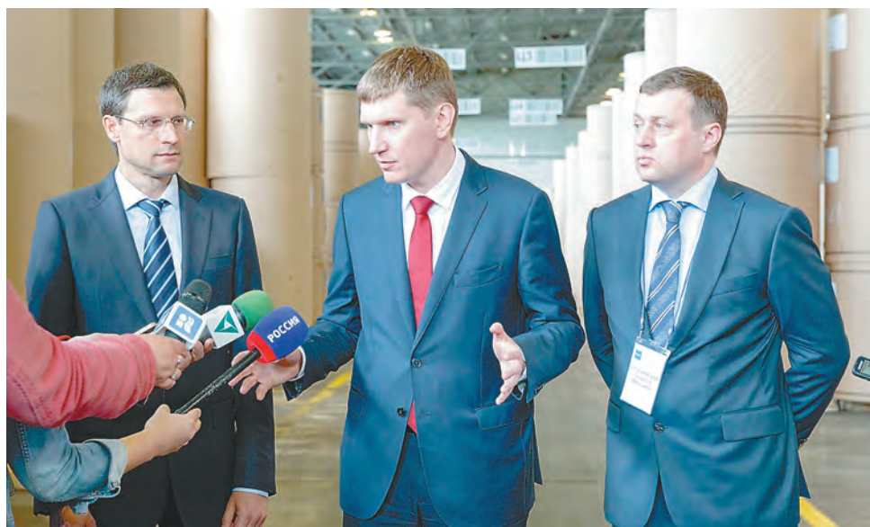
ПЦБК посетили глава Прикамья Максим Решетников и депутат Законодательного собрания края Александр Бойченко

— Инвестиции в ПЦБК позволят практически создать новое производство на территории этой компании. Удваиваются объёмы переработки макулатуры, будут производиться картоны, которые крайне востребованы рынком. Продукция, которую выпускает комбинат, при этом поставляется в другие компании нашего региона — по производству стройматериалов, на предприятия пищевой промышленности. Таким образом, мы удлиняем цепочку создания добавленной стоимости на террито-