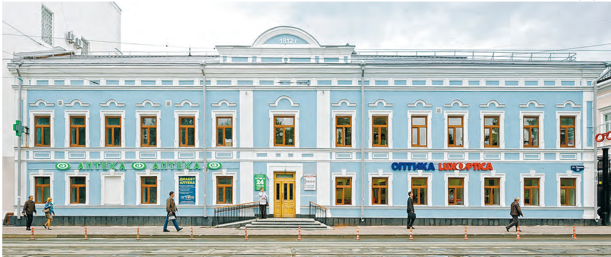
Городской центр коррекции зрения, ул. Ленина, 30

Компания идёт в ногу со временем: основываясь на большом опыте работы, руководство регулярно инвестирует средства в обновление технологического, диагностического и торгового оборудования, от которого зависит уровень обслуживания посетителей. Первой оптической компанией в Перми, которая для удобства покупателей применила формат открытой выкладки товара «без замков», стала именно ZEN®ОПТИКА. Была внедрена понятная и удобная для покупателя система «всё включено»: в стоимость очков включены линзы, оправа, работа.