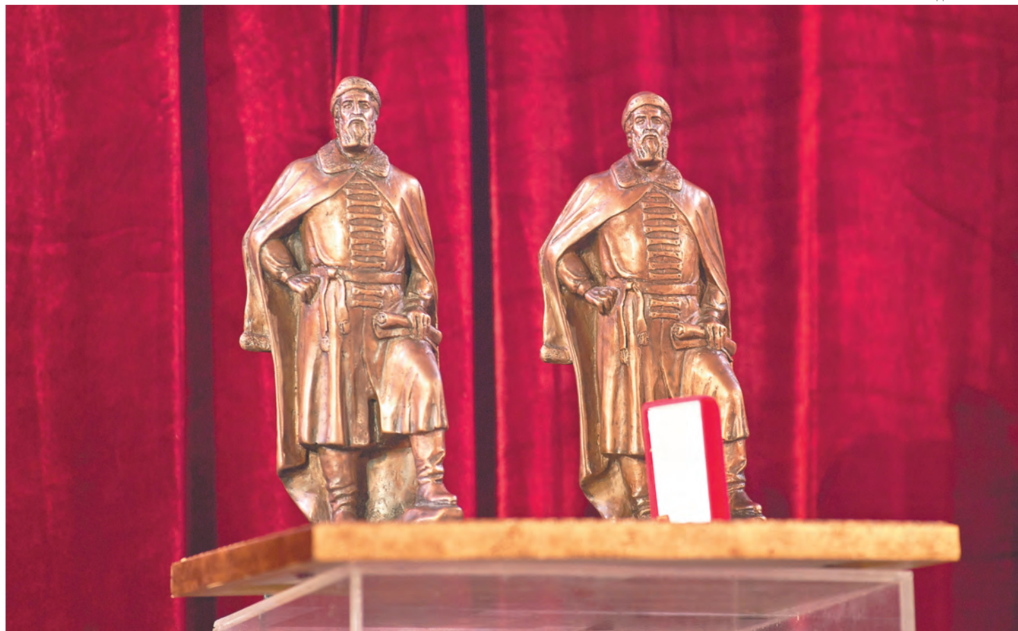
Аника Строганов — основатель династии и символ Строгановской премии