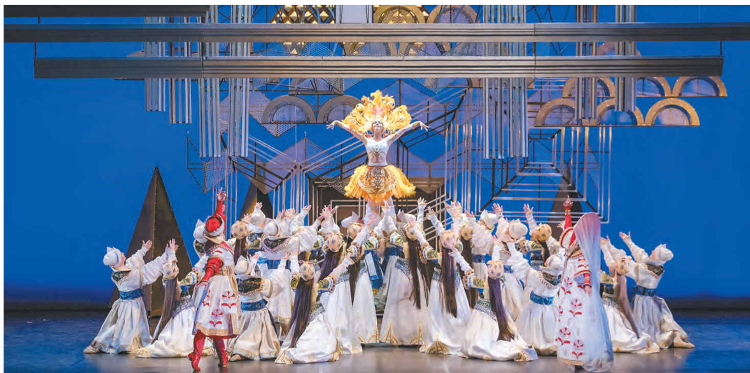
Балет «Жар-птица» и весь балетный вечер Стравинского завершился эффектной сценой в духе красочных спектаклей Михаила Фокина