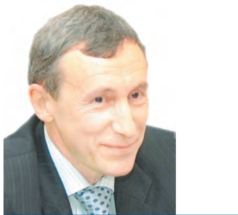
Андрей Климов, сенатор

2017 год даёт хороший повод задуматься о судьбе пермского речного транспорта