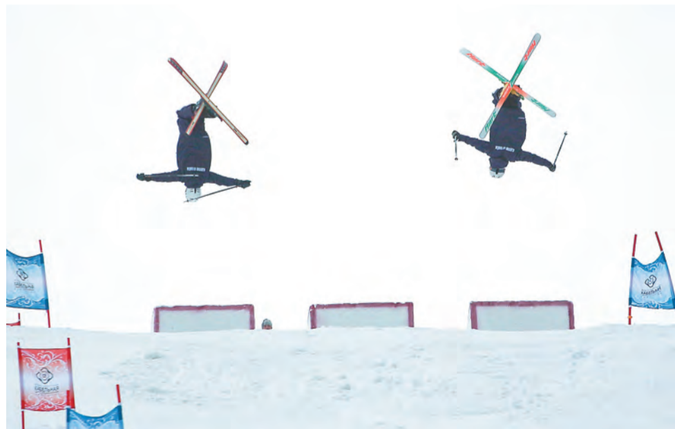
В Чусовом готовят спортсменов мирового уровня, работают горнолыжные курорты, действует спортивная трасса

По словам эксперта, по каждому моногороду на федеральном уровне утверждается паспорт проекта, в котором прописаны планы создания в нём рабочих