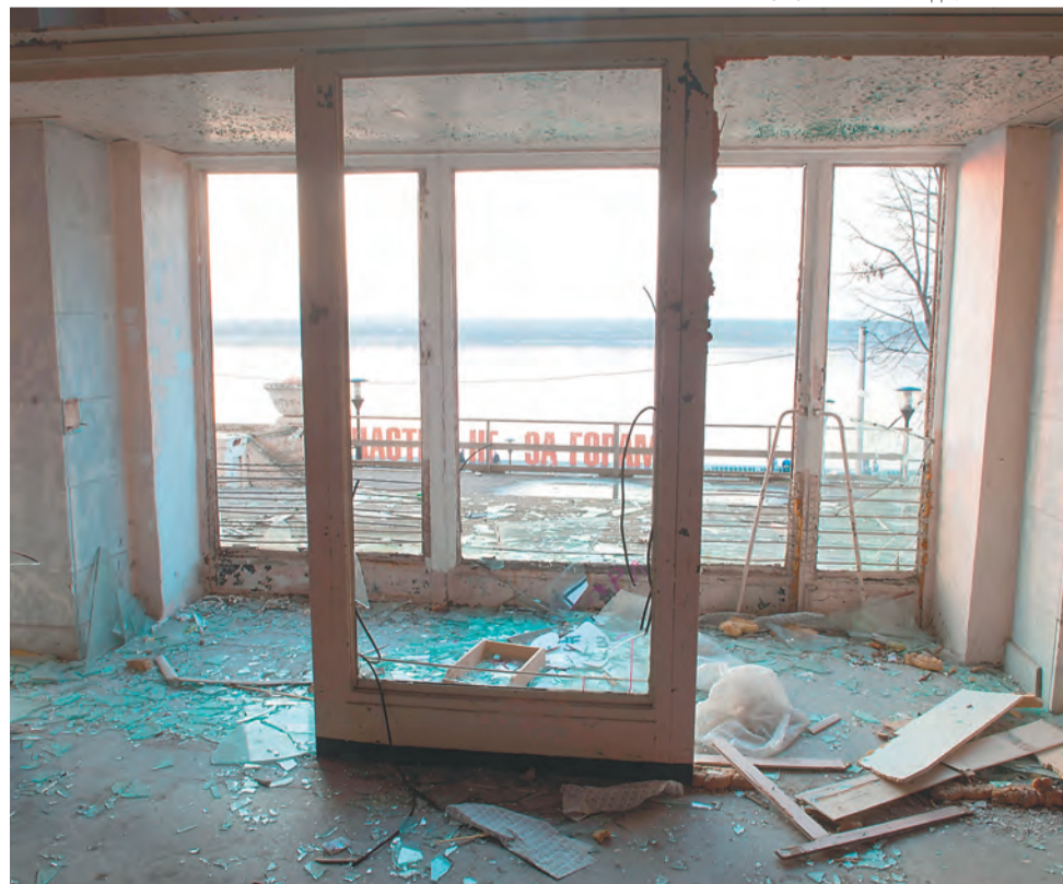
Нынешнее состояние Речного вокзала ярко характеризует положение с речными перевозками в Пермском крае