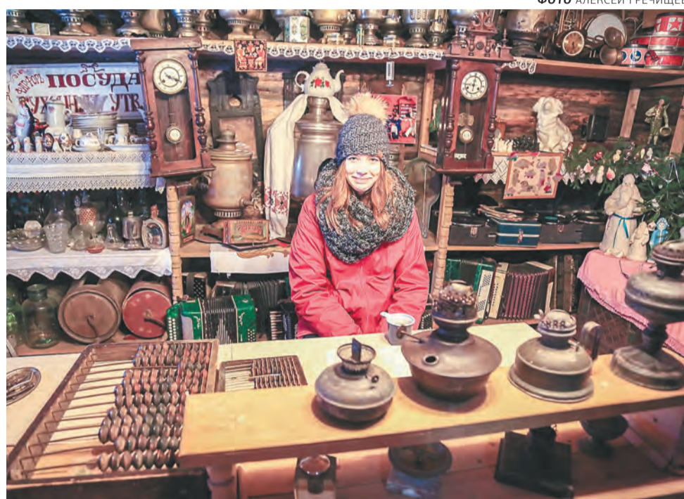
Сейчас в Чусовом зарегистрировано 1366 предпринимателей и более 900 юридических лиц: это 8% всего населения города

«Сейчас на территории зарегистрировано 1366 предпринимателей и более 900 юридических лиц. Более 2 тыс. предпринимателей — это 8% всего населения города. Значительная цифра. Если благодаря программе социального предпринимательства каждый год будет прибавляться 10–20 новых субъектов, это замечательно, — признаётся Старкова. — Проекты в этом году интересные и проработанные — от экодеревней до театрализованных представлений. Муниципалитет не даст этим проектам уйти в «любители». У нас много инструментов поддержки предпринимательства, предоставляются займы на развитие бизнеса, даются муниципальные площади, работают обучающие программы. Начинающему бизнесу обязательно нужно обучение».