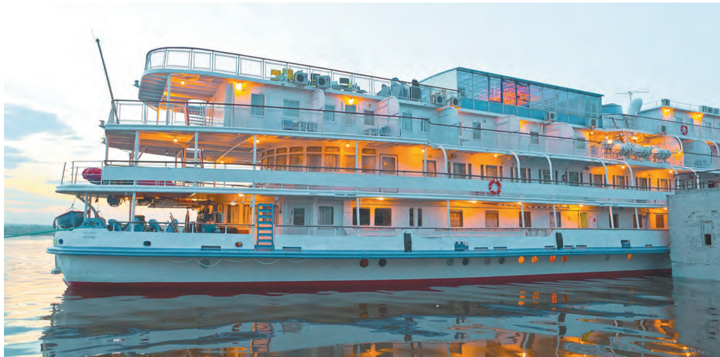
Главная проблема водного туризма в Пермском крае — отсутствие причалов в прибрежных городах

Только у бюро «Спутник» в наличии четыре теплохода: четырёхпалубный «Маяковский» и три трёхпалубных — «Кутузов», «Бажов», «Пушкарёв». Каждый из теплоходов способен принять более 200 пассажиров. А ведь в Перми работают и другие туристические компании, и поток отдыхающих, который генерирует «Спутник», — это далеко не все туристы, заинтересованные в отдыхе на реке. Туристические компании в рамках круизных туров знакомят отдыхающих и с достопримечательностями