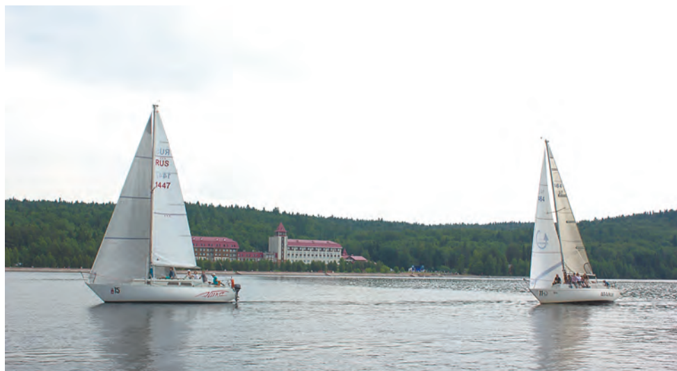
В Перми можно организовать яхтенный туризм с участием в международных регатах

Попытки восстановить в Перми туристическое судоходство стали предприниматься пару лет назад. Так, Росморречфлотом в госзадание для «Камводпути» был включён участок от промышленного порта Соликамск до пристани города Соликамска длиной 19 км, включая Боровскую воложку (подход к пристани Соликамска). На восстановление участка выделено из федерального бюджета порядка 30 млн руб. В 2016 году до