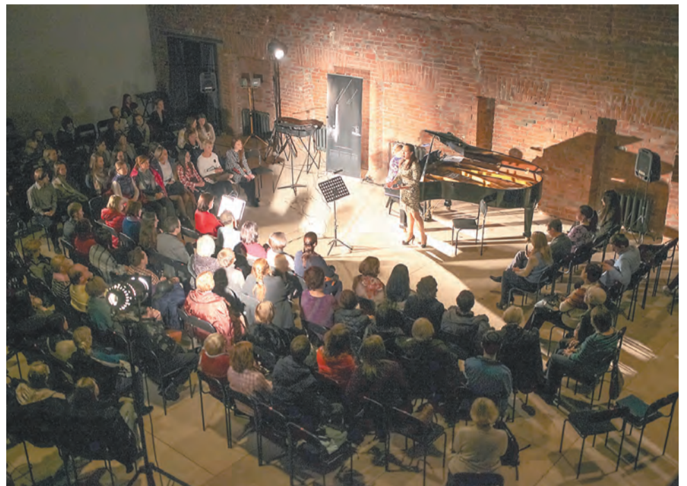
«Лаборатория современного зрителя»