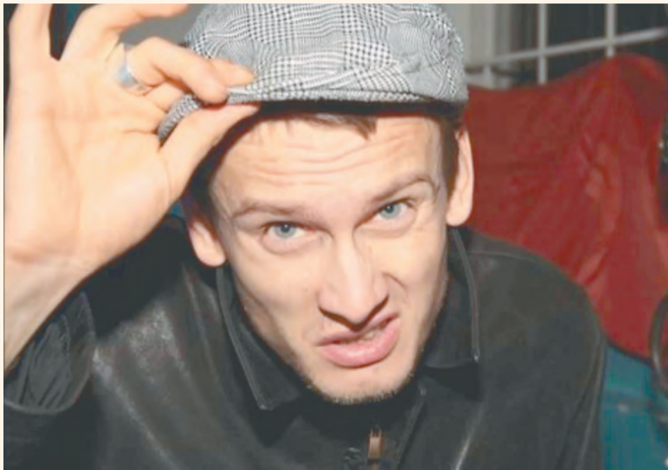
Пермский рэпер Сява достиг всероссийской известности как выразитель «эстетики гопничества»

ские группы, которые профессионально используют силу и с помощью личных отношений добиваются чего-то большего. Демократичность в этих сообществах присутствует лишь на уровне риторики, потому что культура пацанов подразумевает строгую иерархию, как и в аристократии.