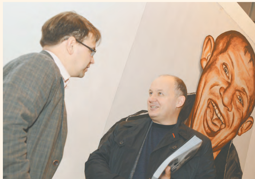
...и ею живо интересовались представители пермского истеблишмента