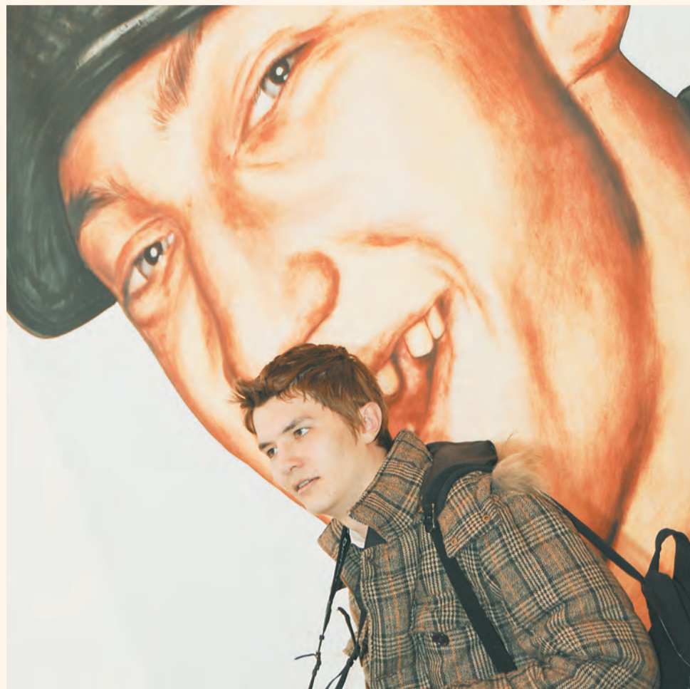
В Перми «культуру гопников» начали продвигать ещё в ходе нашумевшего «Евангельского проекта» музея PERMM в 2009 году...

ла привела клип на песню рэпера Сявы «Бодрячком!» 2008 года и клип «Слово пацана» Макса Коржа 2016 года, эдакого холёного полухипстера-полугопника. «Что так изменилось в восприятии гопников за восемь лет?» — задаётся вопрос историк.