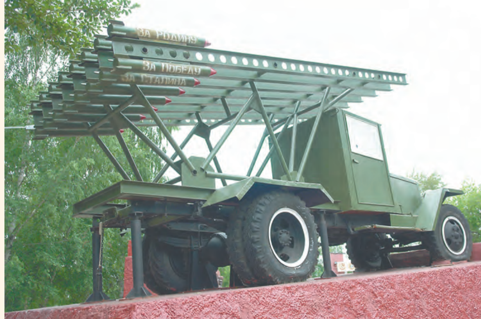
Цех по производству балластного топлива Пермского порохового завода работает по технологии 1943 года