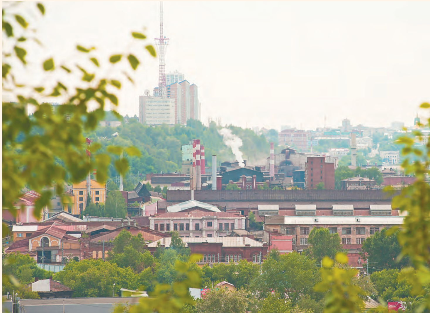
На «Мотовилихинских заводах» почти полностью обновлено артиллерийское производство, на 2017 год запланирована реализация проекта по строительству нового прокатного стана

У каждого завода своя, уникальная история старения. У завода им. Дзержинского она была отягощена рейдерскими захватами, продажей производственных площадок, разбазариванием государственного имущества. Понятно, что в этот период имущество распродалось, никакой модернизации не проводилось. «С середины 2011 года и по сегодняшний день мы предпринимаем все шаги для того, чтобы собрать воедино все производственные мощности, возвращаем утраченное имущество. Нам удалось вернуть промышленную площадку №5 и трансформаторную подстанцию в собственность государства. Был создан единый имуществен-