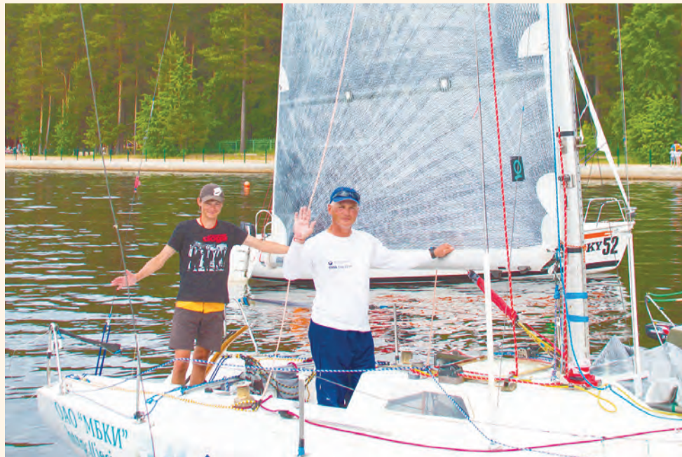
Команде ИД «Компаньон» повезло с яхтой и шкипером, но не повезло с бдительными судьями