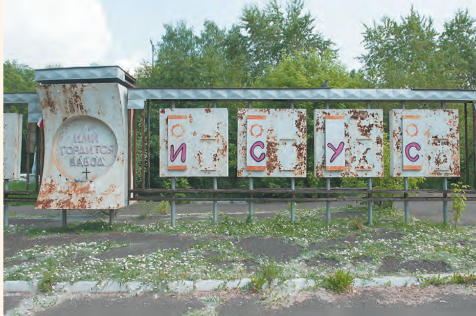
По мнению руководства Зид, предприятия тянут вниз расходы на содержание багажа непрофильных активов