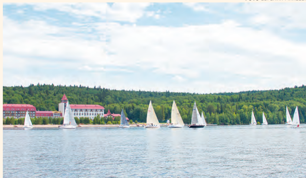
Желающих побороться за кубок «Демидково» с каждым годом становится всё больше