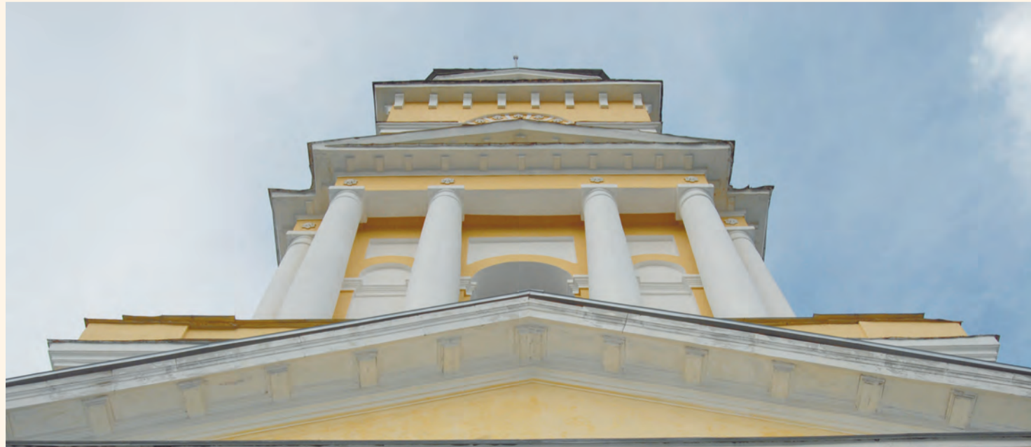
Немногие помнят, что история переездов галереи началась ещё 84 года назад