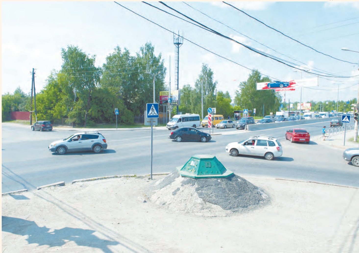
На перекрёстке улиц Спешилова и Борцов Революции планируется построить развязку, но пока неясно, за чей счёт