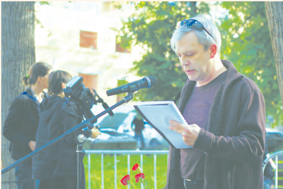
Акция «Возвращение имён»