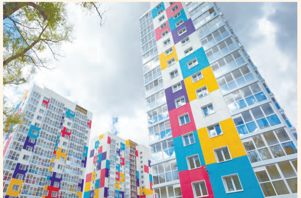
В номинации «Жилая недвижимость», на которую было подано наибольшее число заявок, лауреатом стал ЖК «Аврора», девелопер — PAN City Group

«Начинание позволяет позиционировать Пермский край как движущую силу