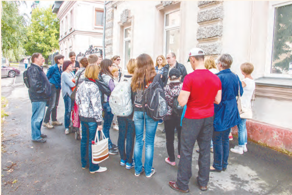
В программе фестиваля есть экскурсии по исторической Перми