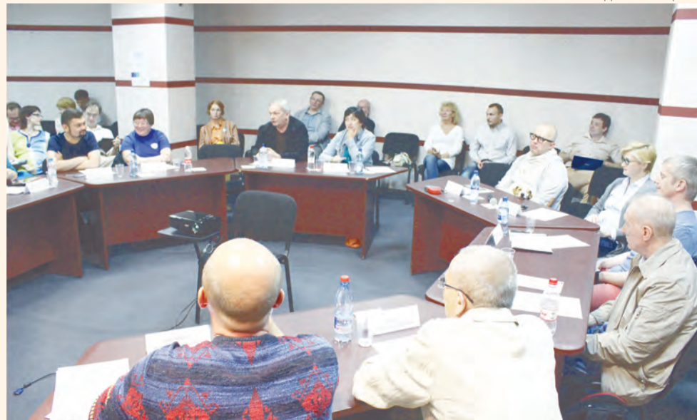
Главный жанр на фестивале — разговорный