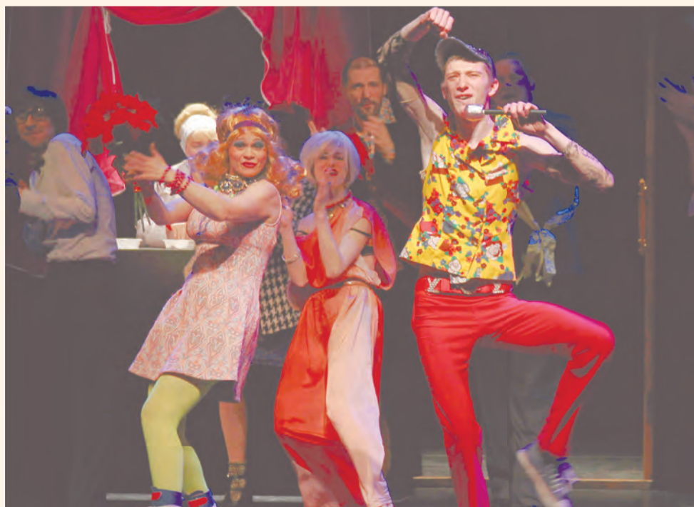
«Скрипка, бубен и утюг»

«Коляда-Театр» показал пермской публике русское безумие, одетое в разные карнавальные костюмы. Будь то пушкинская трагедия, театрализованый гоголевский эпос или новая свадебная комедия, проблемы бедовых людей (всех нас?) смягчались динамичной актёрской игрой, бурным мизансценированием и пёстрыми декорациями. Однако под шутовством обычно скрывается социальная критика, а в случае «Коляда-Театра» — рефлексия на уровне национального самосознания.