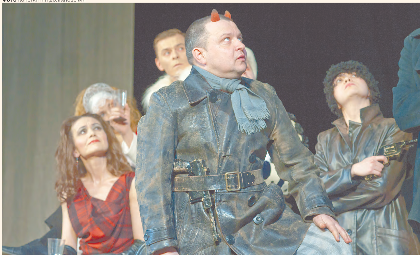
Театр юного зрителя

Меня награждают «Оскаром» и премией фантастической!