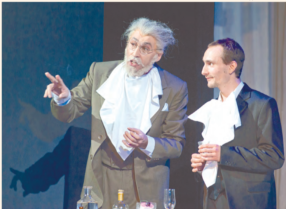
Театр оперы и балета