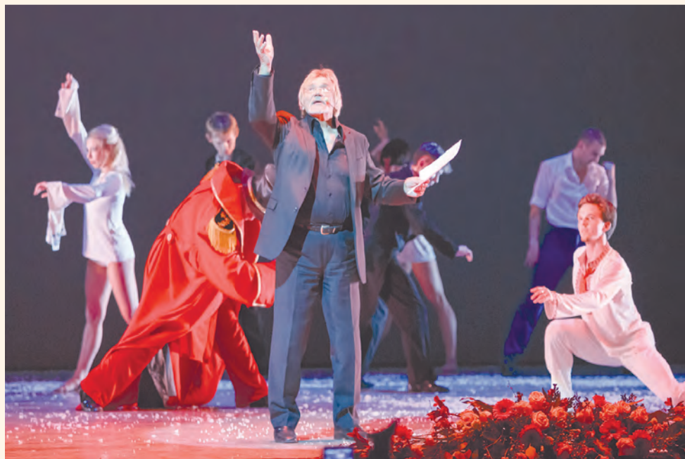
Режиссёр-постановщик Владимир Васильев

Хореография Могилёва сама по себе радикальна и требует огромных физических усилий от исполнителя — в данном случае самого автора. Но плюс к ней в спектакле используется видеоарт, основанный на графике Вадима Миргородского. Видеоарт столь активен, что порой ловишь себя на том, что смотришь не балет, а видео, но нельзя не признать, что сочетаются они идеально: танцовщик становится персонажем мультфильма, буквально вписывается в экран!