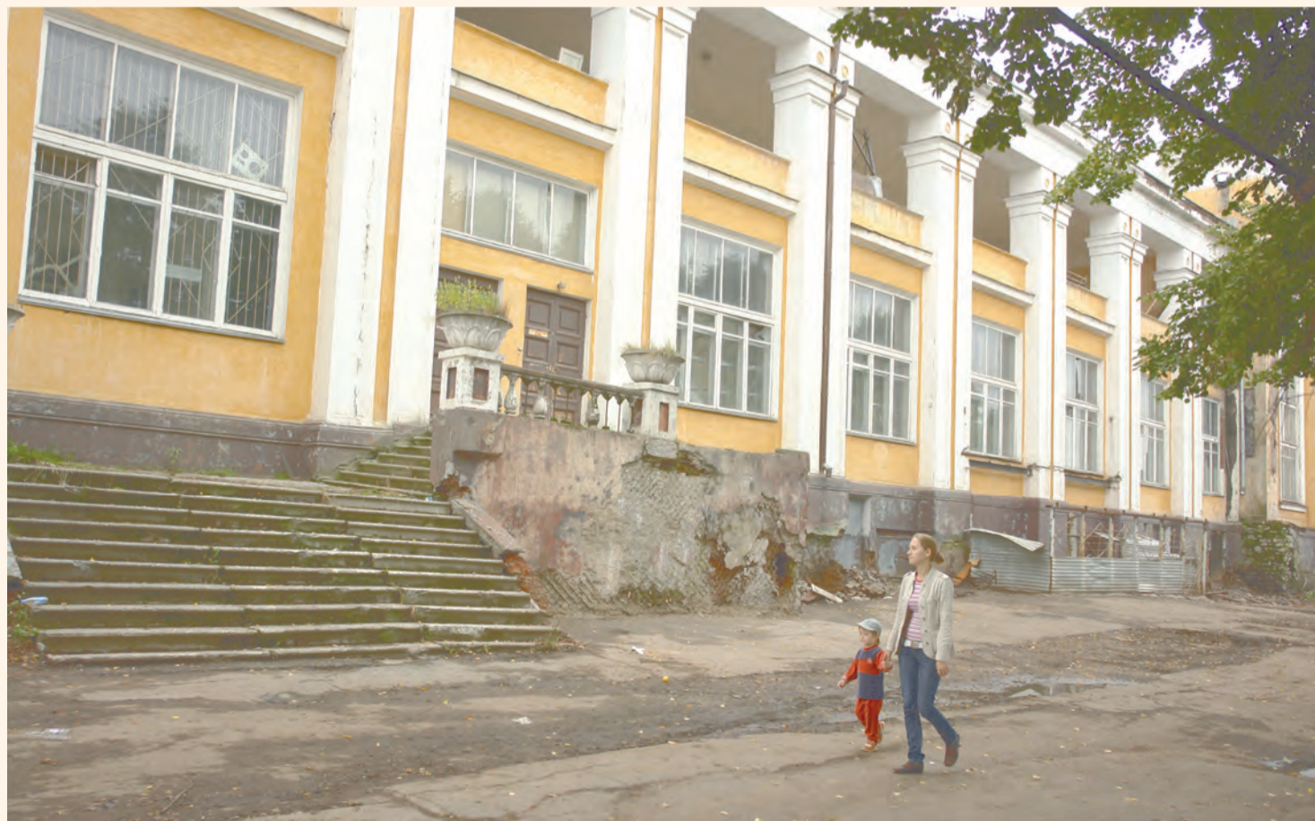
Речной вокзал будет реконструирован и приспособлен для современного использования: с момента подписания договора на строительство отведено 487 календарных дней

Но дорожную инфраструктуру депутаты рассматривать не стали. Они решили посвятить этой теме отдельное совещание и провести его в ближайшее время.