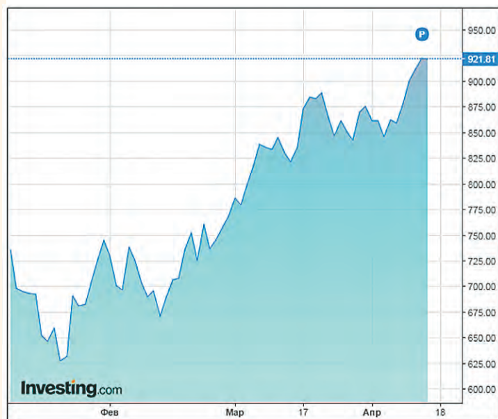
Динамика индекса РТС