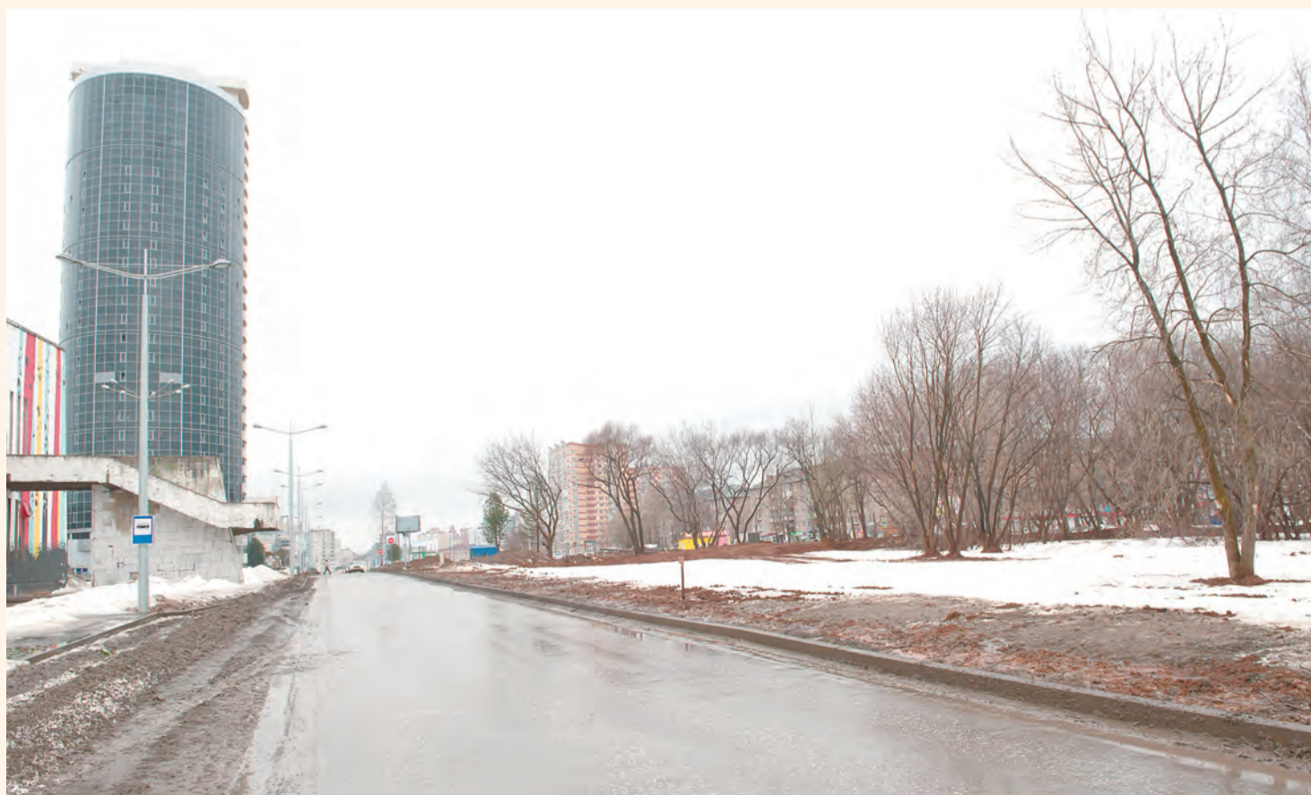
Улицу Макаренко планируется сдать в эксплуатацию раньше срока

— Да, администрация Перми уже испытывает проблемы с поиском нормальных, добросовестных и исполнительных