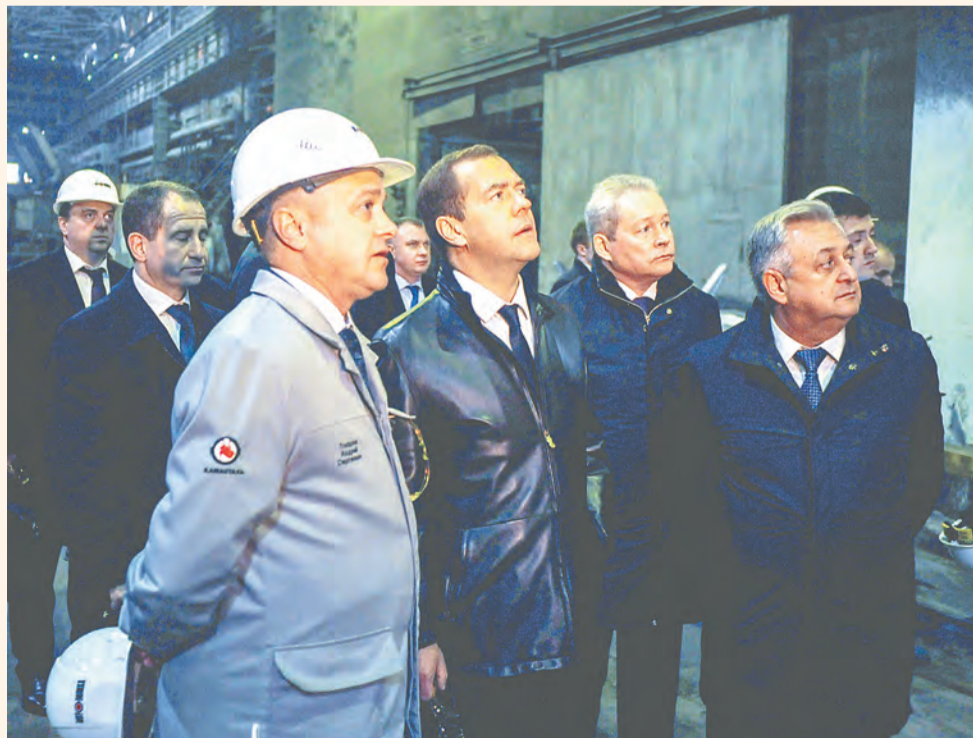
Дмитрий Медведев лично выбрал местом проведения совещания именно «Мотовилихинские заводы»

По словам премьера, одна из причин спада в отдельных отраслях металлургии — сокращение внутреннего спроса. «По сравнению с 2014 годом объём потребления металлопроката на внутреннем рынке по чёрным металлам упал на 9%, на 12% уменьшился спрос крупнейшего потребителя проката — это стройиндустрия, и на 25% — в автопроме, который тоже находится в непростой ситуации», — пояснил Дмитрий Медведев, отметив также, что потенциал роста металлургической продукции практически исчерпан, «прежде всего из-за того, что и