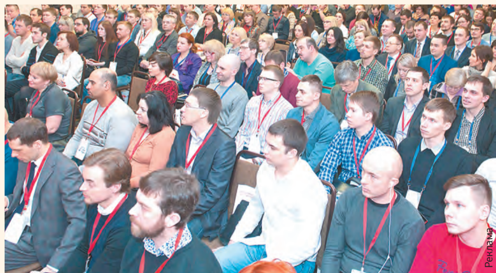
Предпринимательская аудитория высоко оценила советы экспертов

— Наша конференция в Перми проходит во второй раз — в этом году мы увидели много знакомых лиц. Значит, клиенты ценят то, что мы для них делаем. В зоне отдыха были представлены партнёры «Клуба Клиентов» из Перми, у которых была возможность рассказать о себе, о своих услугах, пообщаться с коллегами, установить новые деловые связи. Мы многое делаем для того, чтобы наши клиенты получали новую информацию, развивались, а вместе с ними развивались и мы. В наших хороших взаимоотношениях заложено будущее.