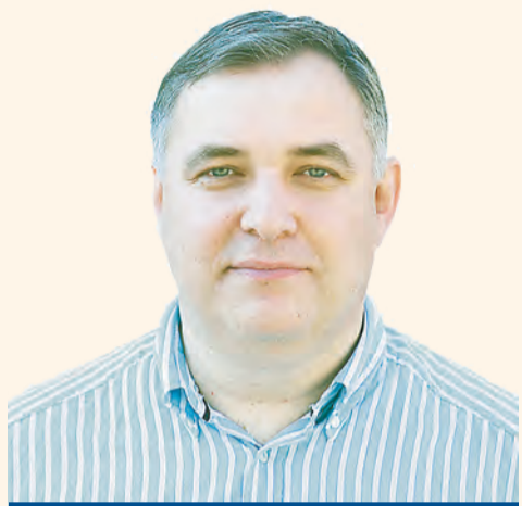
Игорь Макарихин , ректор Пермского государственного национального исследовательского университета

Работать с малыми инновационными предприятиями сегодня тяжело и малоэффективно