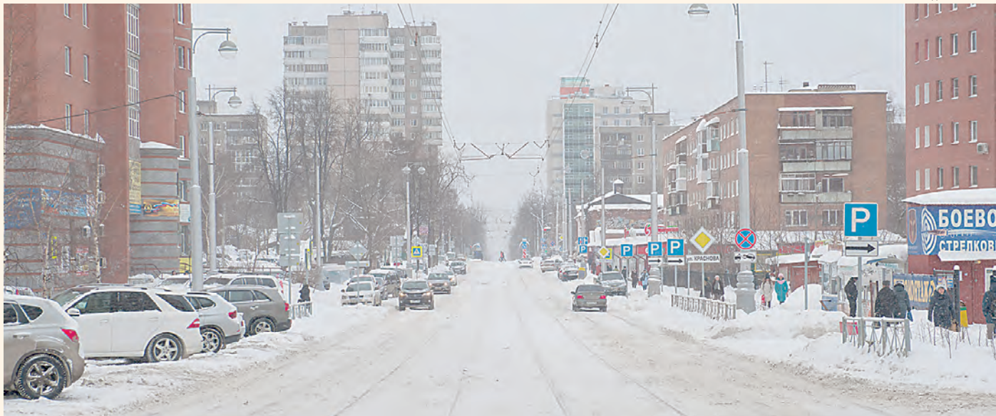
Реконструкция ул. Максима Горького в Перми на 95% профинансирована из краевого бюджета