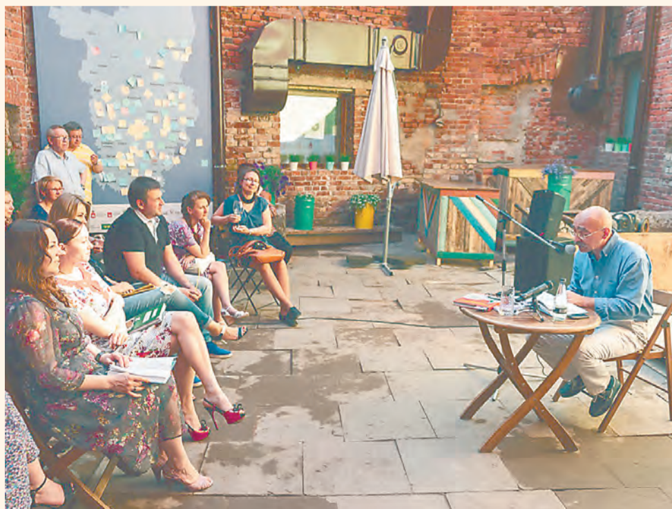
Будет ли в 2016 году фестиваль «Гений места» — пока неизвестно

Ещё один новый, принципиально некоммерческий и негосударственный проект — фестиваль гражданских