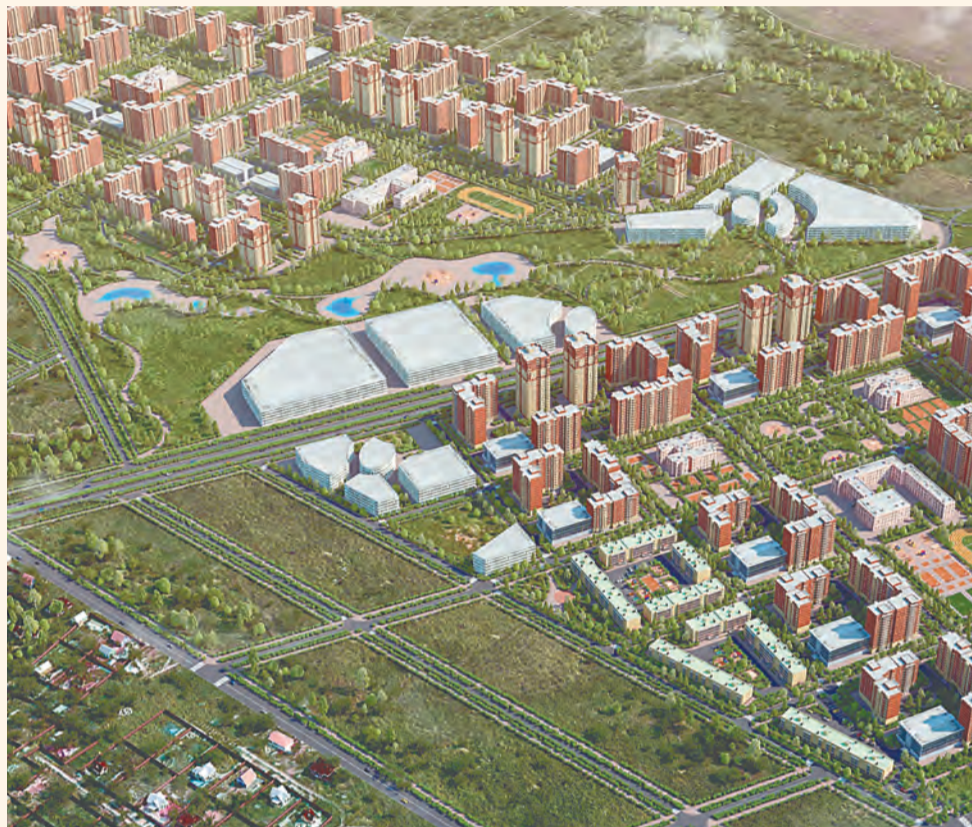
Так выглядит проект планировки микрорайона

ИКЕА уже несколько лет пыталась войти в Прикамье. Но и догово-