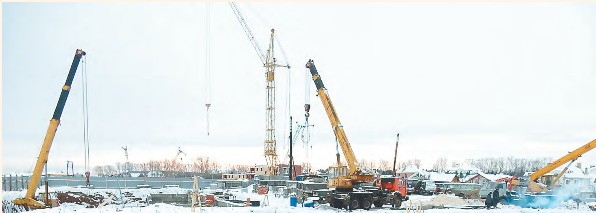
А так обстоят дела на стройке сегодня

Помимо ИКЕА свои торговые центры в Перми построят «Зельгрос» (8,6 тыс. кв. м), ОВІ (10,4 тыс. кв. м) и «РосЕвро-Девелопмент» (150 тыс. кв. м).