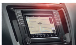
Аудионавигационная система с функцией App-connect 2