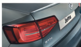
Светодиодные задние фонари 2