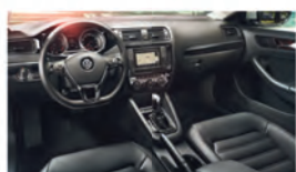
Обновлённый дизайн интерьера