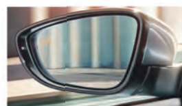
Система контроля слепых зон 2

Преимущества Volkswagen Jetta слишком привлекательны, чтобы оставить их без внимания. Просторный салон, вместительный багажник в сочетании с современными системами безопасности и инновационными опциями управления отвечают за то, чтобы каждое ваше путешествие было удобным и приятным. К тому же, что может быть целесообразнее вложения в свой личный комфорт?