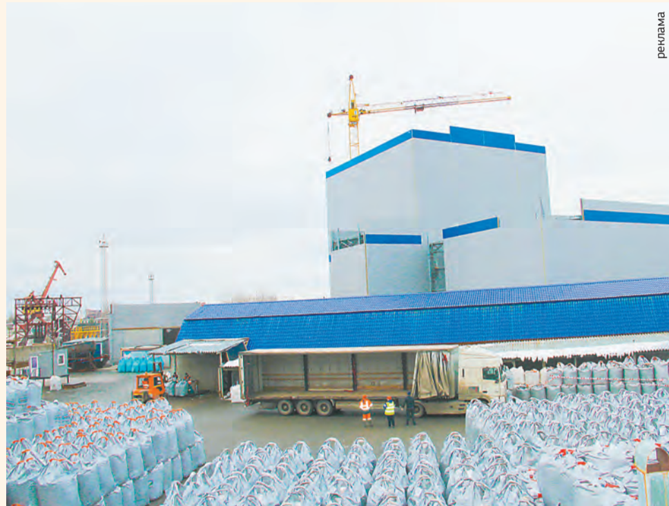
2015 год. Произведена модернизация производства. Построен новый цех

Качество сырья и выпускаемой продукции УЗПМ контролируется химико-аналитической лабораторией на территории предприятия. Раз в год продукция завода проходит необходимую сертификацию в дорожных и гигиенических институтах России.