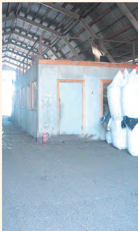
2007 год. Из зданий был один корпус — в нём и разместили производство