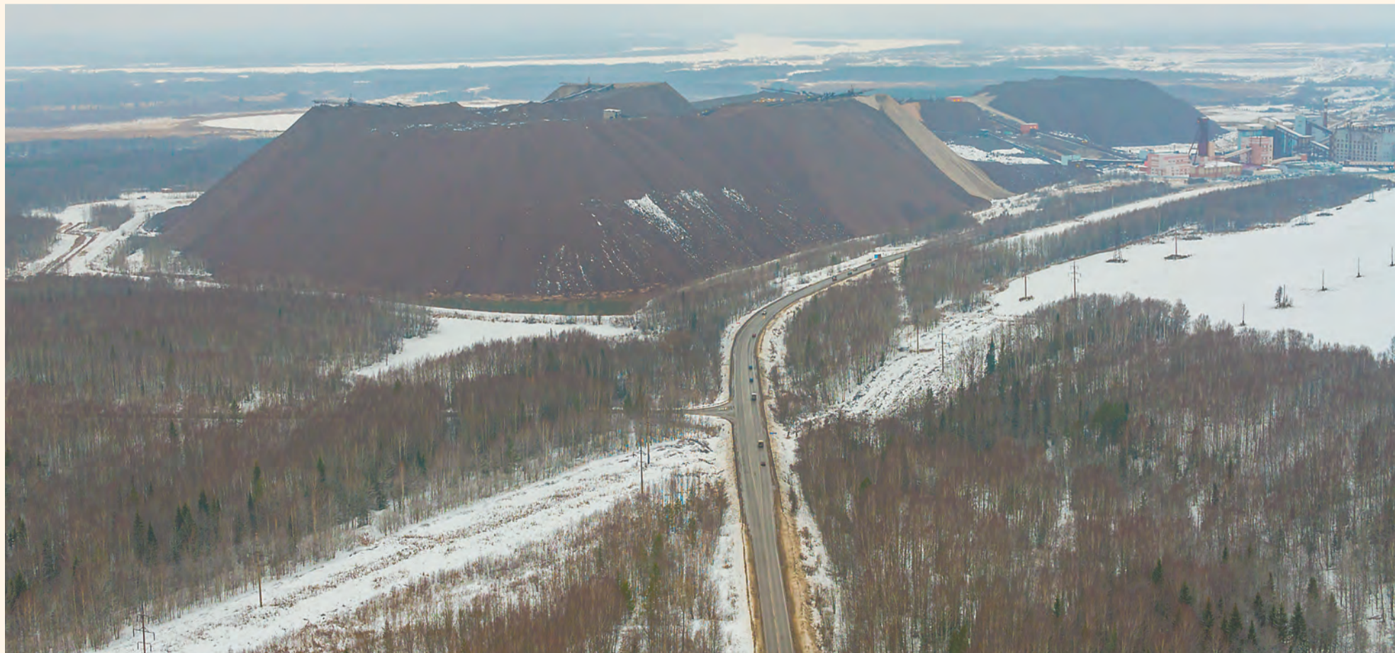
Основным фактором воздействия на окружающую среду являлось накопление на поверхности отходов добывающего производства