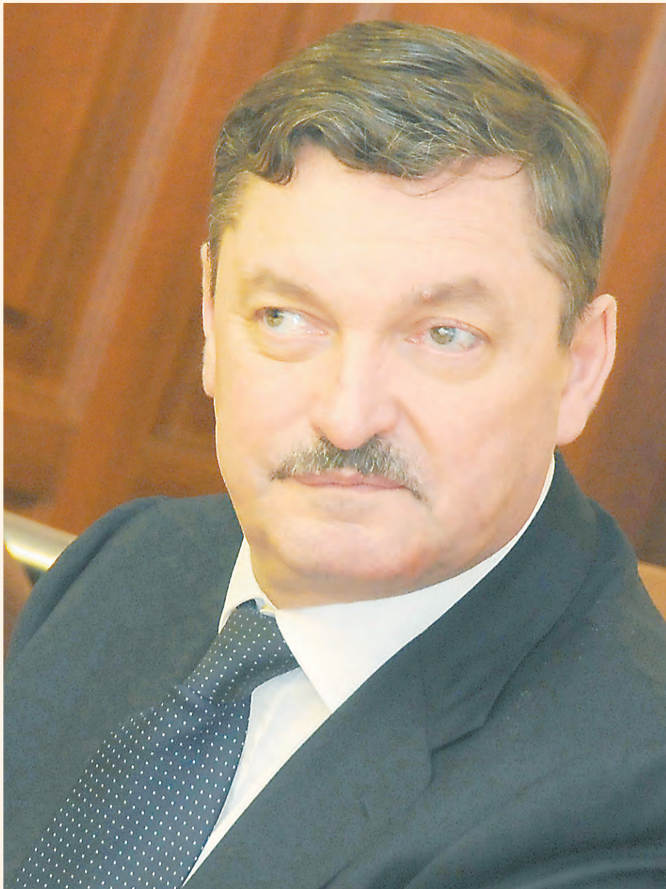
Свою должность покидает Олег Демченко — один из наиболее ключевых и непотопляемых членов команды нынешнего губернатора

Но утверждение прошлой недели о том, что теперь у местных элит возникает ясность, на какую из фигур в краевой администрации и стоит всерьёз ориентироваться, остаётся в силе.