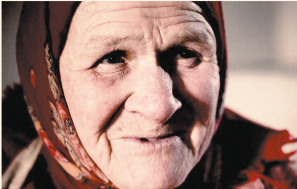
Кадр из фильма Галины Красноборовой «Старухи»