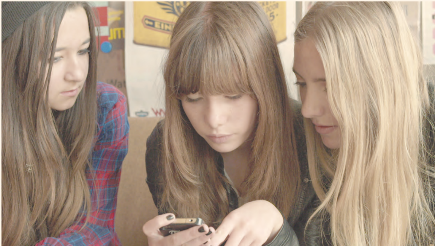
«Мой дорогой долбаный телефон» — фильм из программы Docs & Kids

Свои фильмы представит на «Флаэртиане» председатель гильдии кинокритиков Союза кинематографистов России