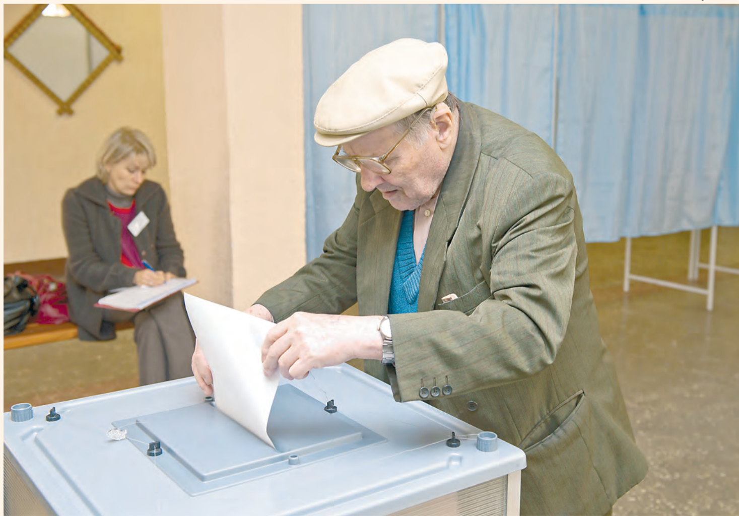
На довыборах в Пермскую городскую думу по округу №32 властям всё же удалось снять риск срыва голосования