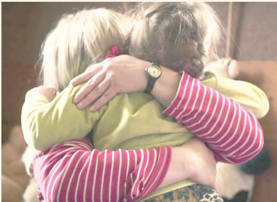
Кадр из фильма Павла Лозинского «Верка»