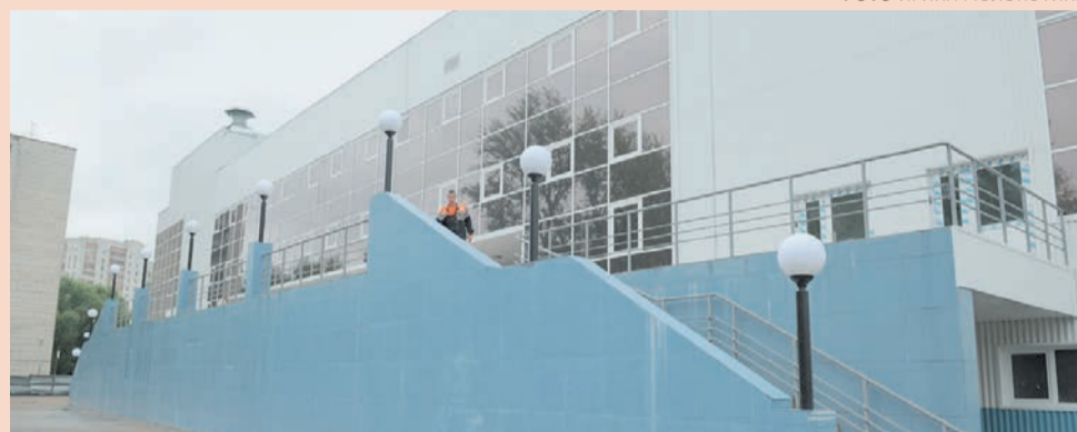
ФОК на Обвинской почти готов

Напомним, 1 июля во время контрольного выезда он принял реше-