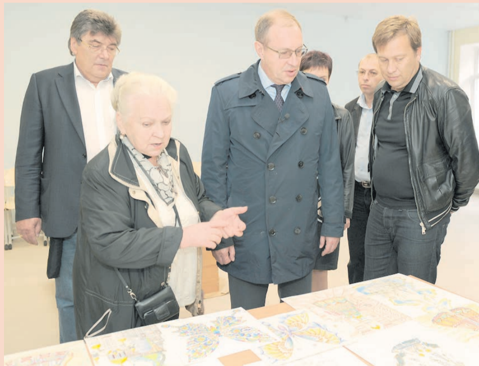
Новый корпус гимназии им. Дягилева 1 сентября откроет двери

ФОК на ул. Обвинской, 9 в Свердловском районе Перми — известный долго-