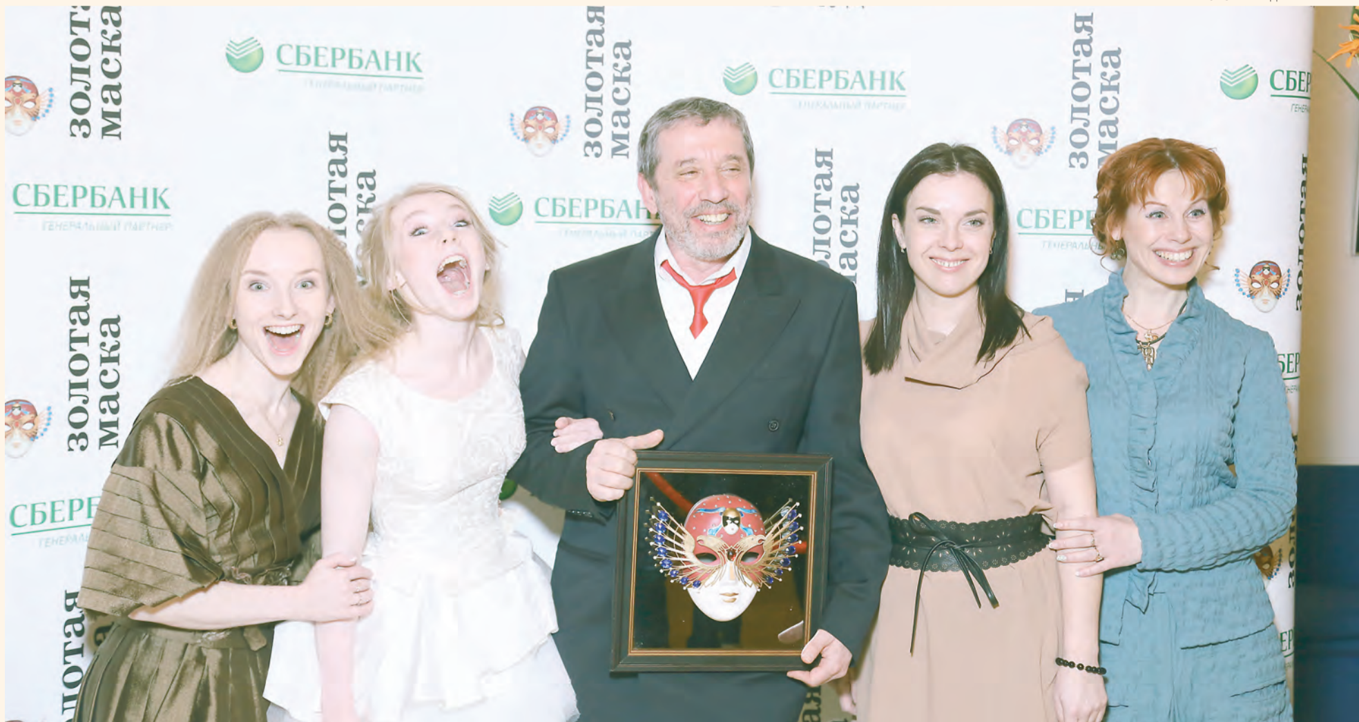
Победители радуются наградам