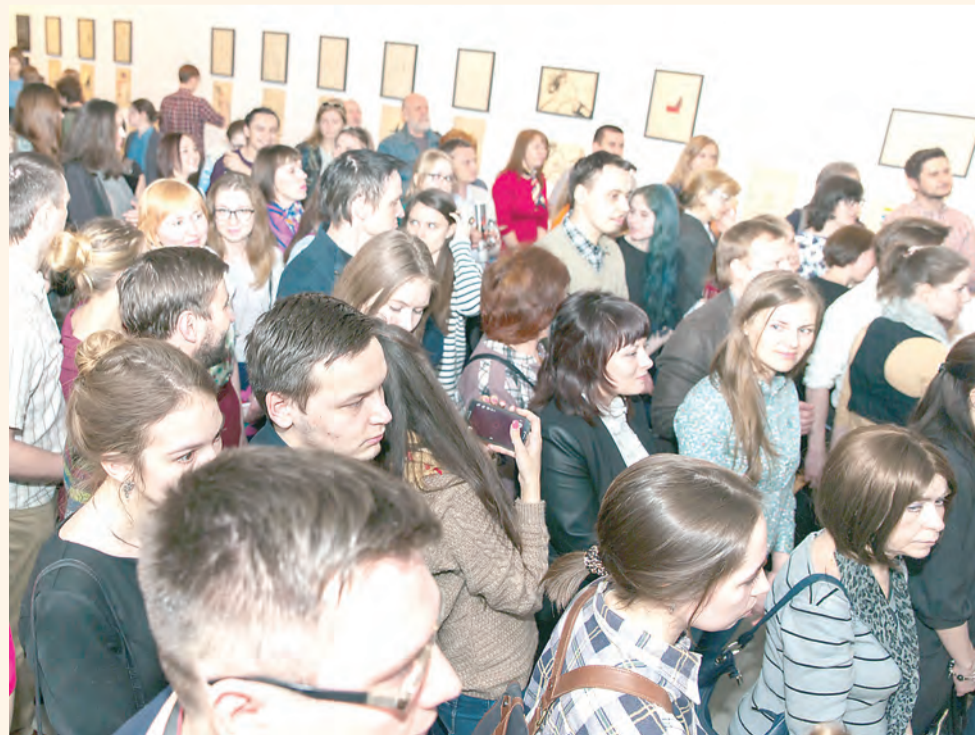
Вернисаж был, как обычно, многолюдным и молодёжным

Словом, разносторонний был человек. Недаром называл себя скромно «работником культуры» — эти слова для него обозначали универсальную модель творческой личности. В его наследии