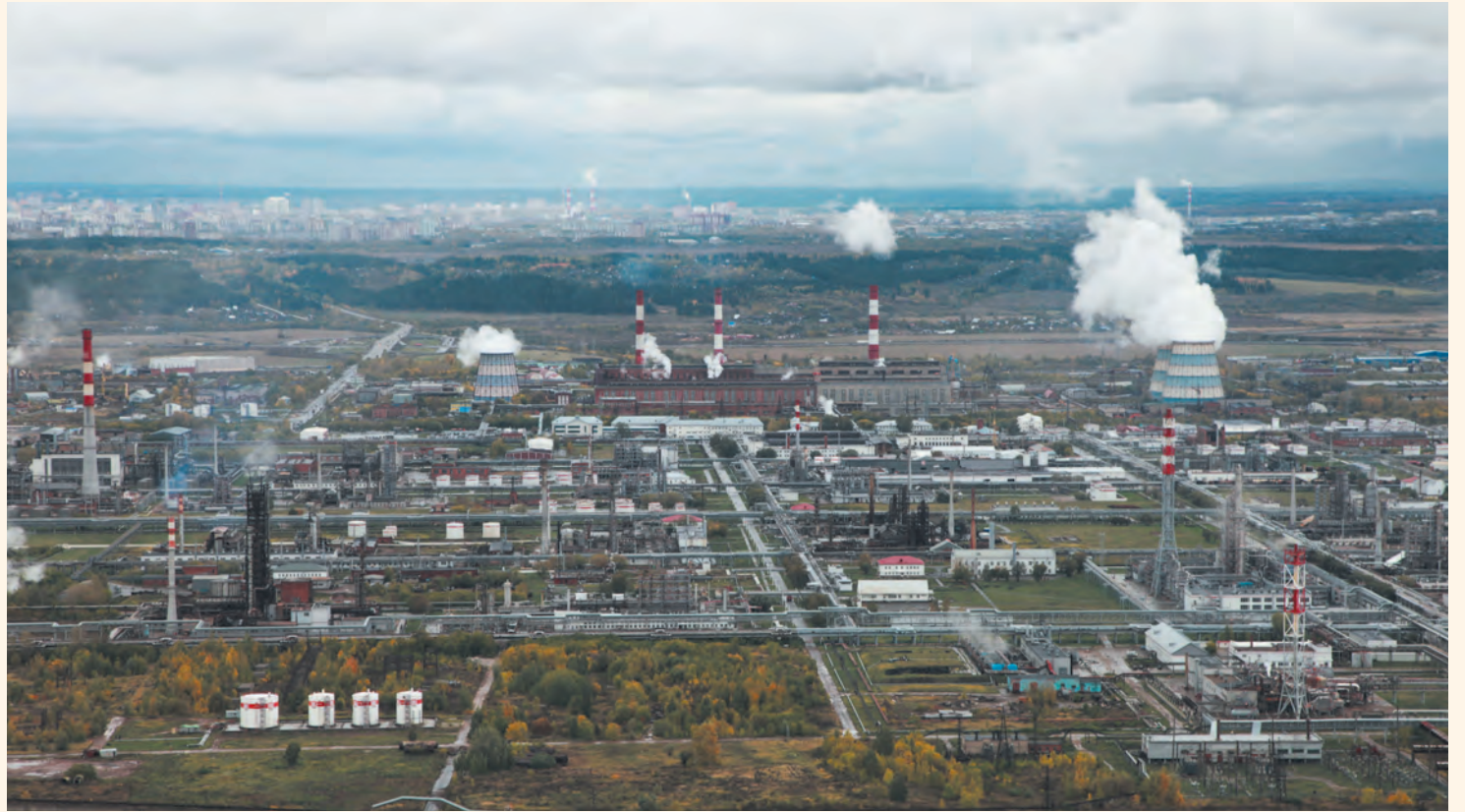
Более половины крупных городов с населением свыше 100 тыс. человек по факту уже непромышленные, но пока это не пермская история

А вот Березники с позиции демографического будущего выглядят очень печально. Этот город будет сжиматься с ускорением, как это уже произошло с Соликамском и всеми другими городами Прикамья, которые уже не будут «стотысячниками». У всех городов Пермского края в существующей демографической ситуации нет ресурсов, чтобы развиваться за счёт естественного прироста населения. Это данность, с которой надо смириться и жить в новой реальности.