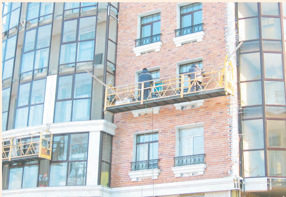
Монтаж клинкерного фасада

«ГлавСтройИндустрия» прекрасно понимает, что столь амбициозный проект ко многому обязывает. Будущим жильцам не стоит беспокоиться по поводу изменения экономической ситуации и роста курса валют: все основные материалы уже закуплены, строительство дома в завершающей стадии. И что бы ни происходило в мировой экономике, проект будет доведён до счастливого финала без компромиссов и отступлений от первоначальной концепции.