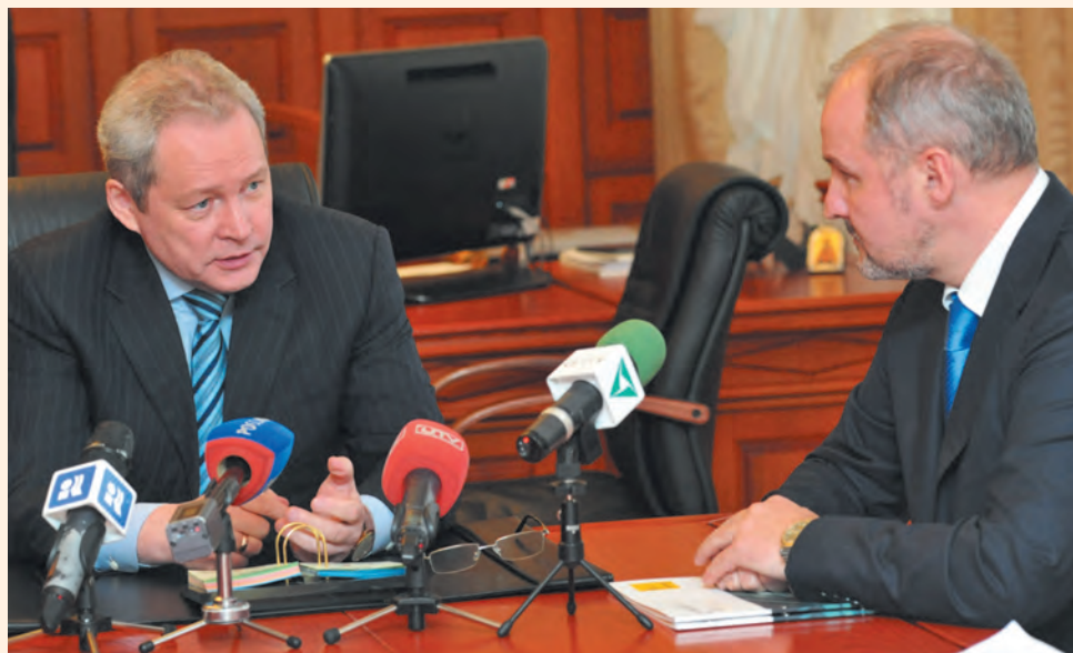
Виктор Басаргин подтверждает: в жёстком конкурсе победил достойнейший

— Я думаю, что в эти сжатые сроки взятые взаимные обязательства должны быть исполнены. Задача так поставлена губернатором, и мы рассчитываем, что