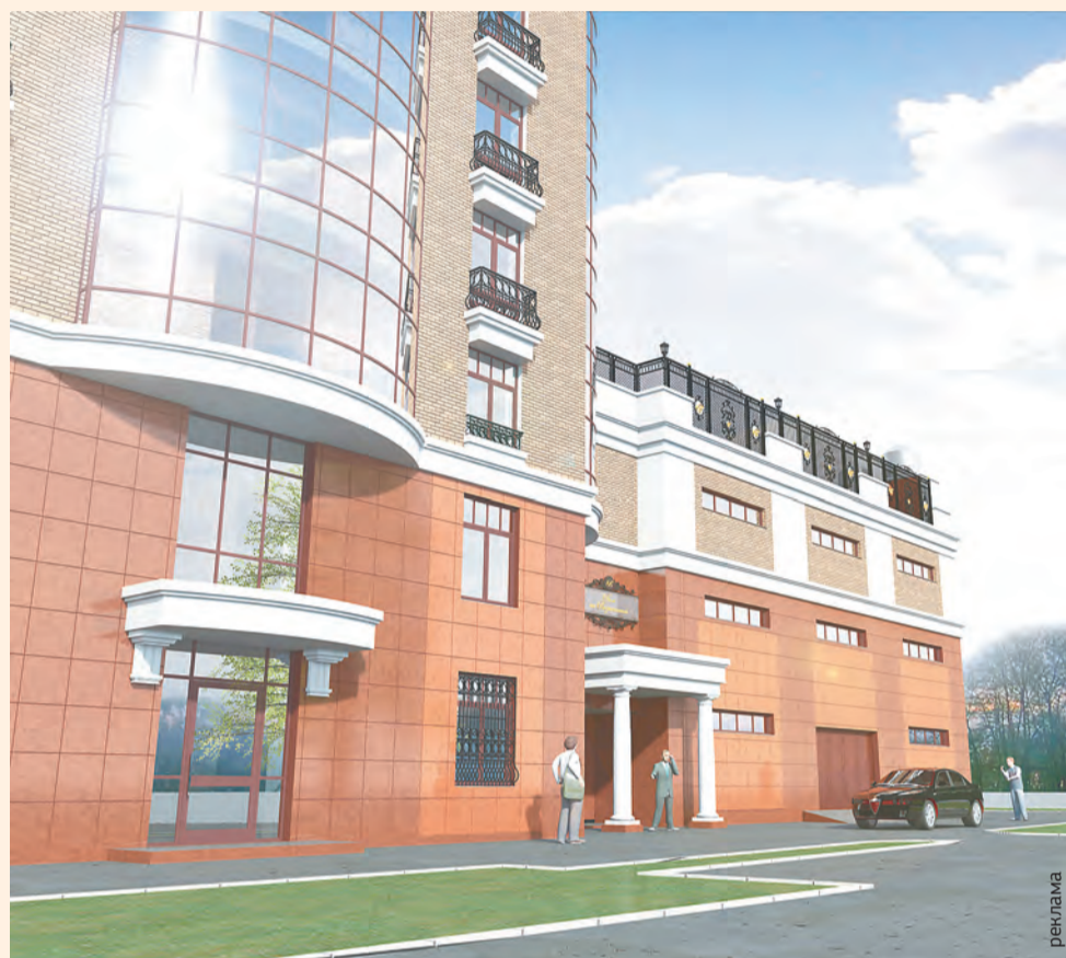
Дом на Вознесенской: южный фасад

Например, мы отказываемся, когда субподрядчик выходит с предложением заменить качественный датский утеплитель украинским, потому что он дешевле и есть на складе в Перми: мол, всё равно его никто не увидит. Для нас не стоял и вопрос упрощения или экономии при выбо-