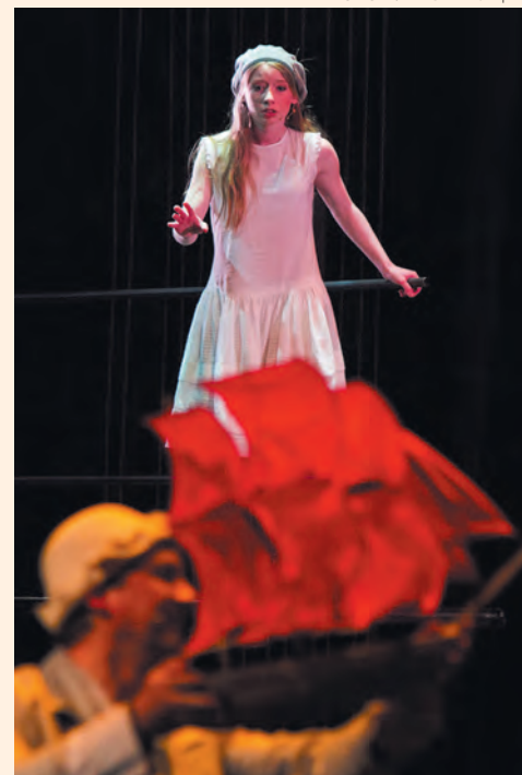
...Остаётся надеяться, что «Паруса на закате» будет не хуже