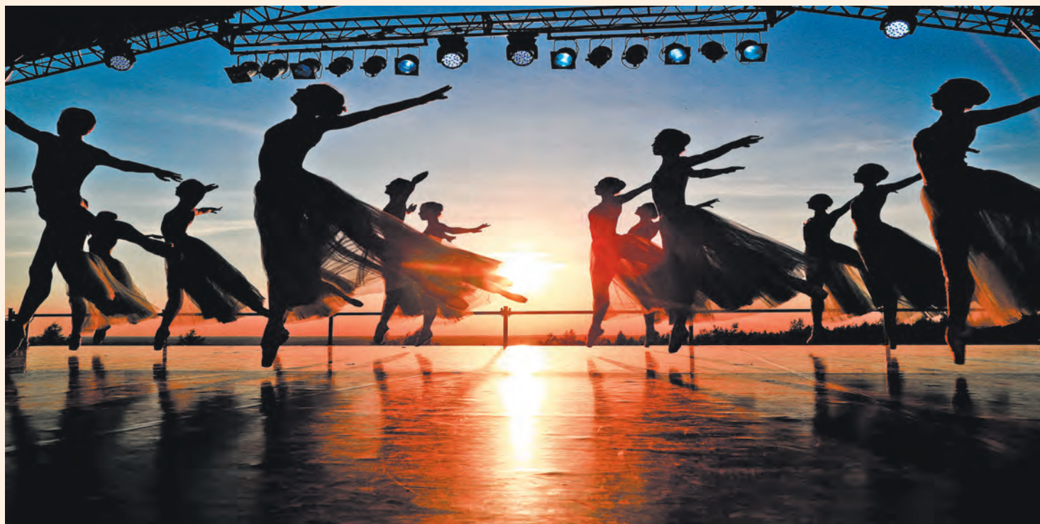
«Балет на закате» оставил прекрасные воспоминания...