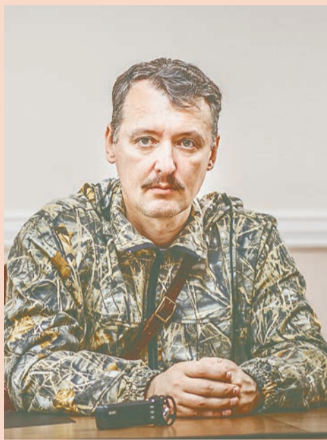
Политическая жизнь Пермского края обретает новые краски. Представительство движения «Новороссия» на этой неделе в Пермь приедет открывать бывший министр обороны ДНР Игорь Стрелков