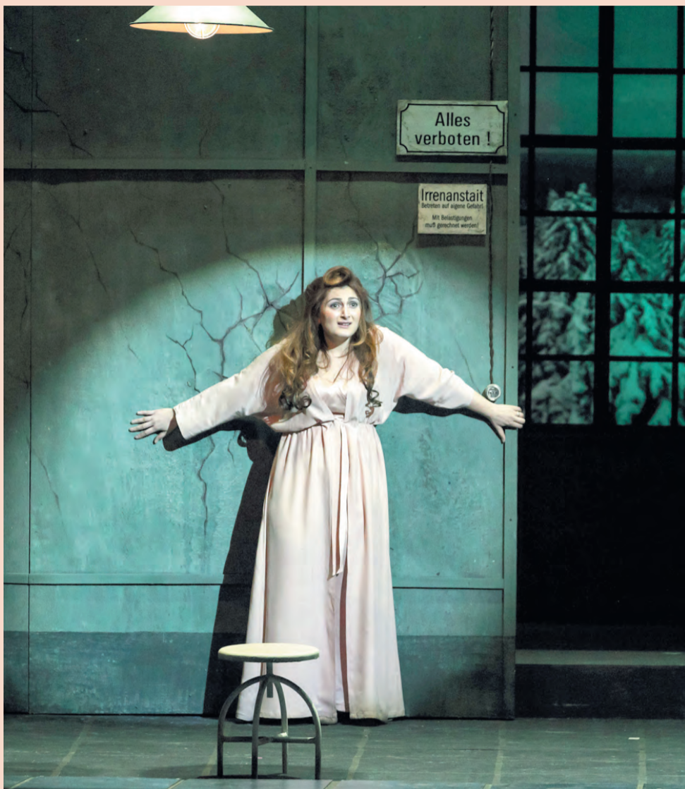
Сейчас из этой стены появятся призрачные руки

же мастерски владеют, да и выглядят очень стильно в мужских костюмах.