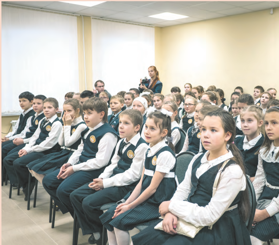
Ученики школы №2 на открытии «Музыкальной гостиной»