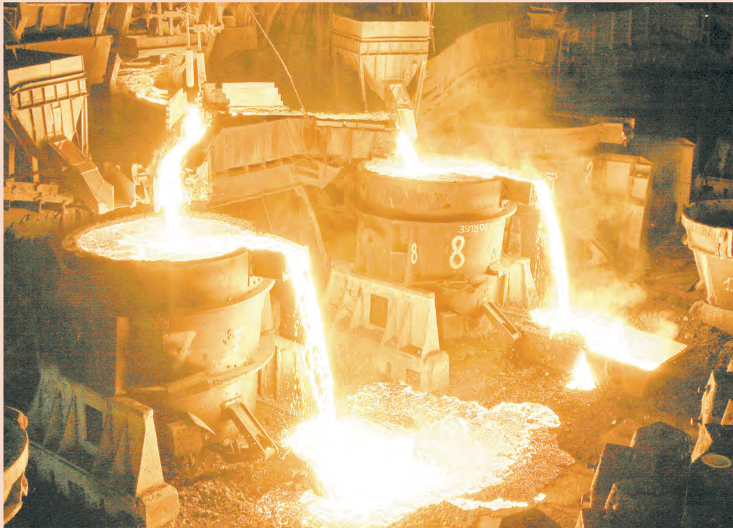
Сроки реконструкции Чусовского металлургического завода горят в пламени валютного курса