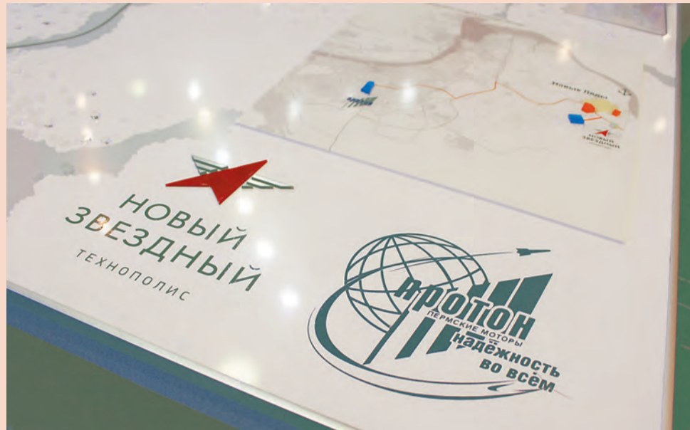
Проект «Новый Звёздный» ведётся с привлечением российских компаний и желает его более устойчивым

гружен, у нас не будет другого выхода, нежели принимать решение о сокращении, исходя из ситуации на рынке», — признаются в ОМК.