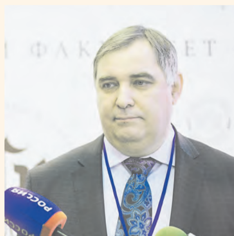
Игорь Макарихин — ректор Пермского государственного национального исследовательского университета