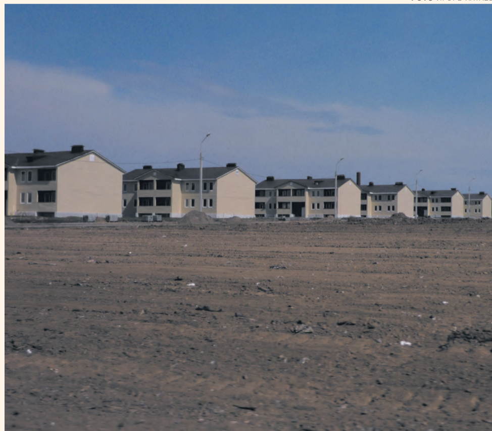
... и в нём нужно учесть ошибки предыдущего проекта