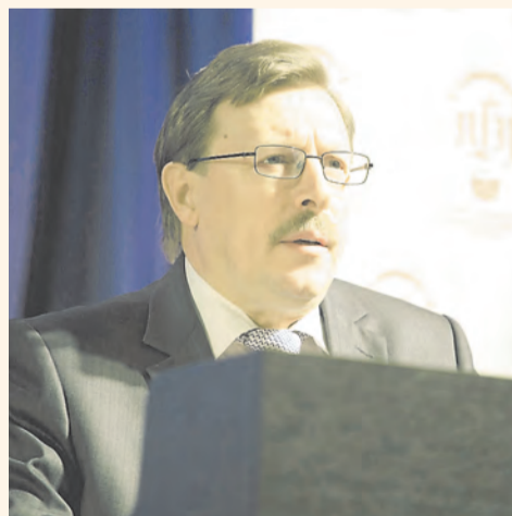
Виталий Фофанов — председатель Арбитражного суда Пермского края