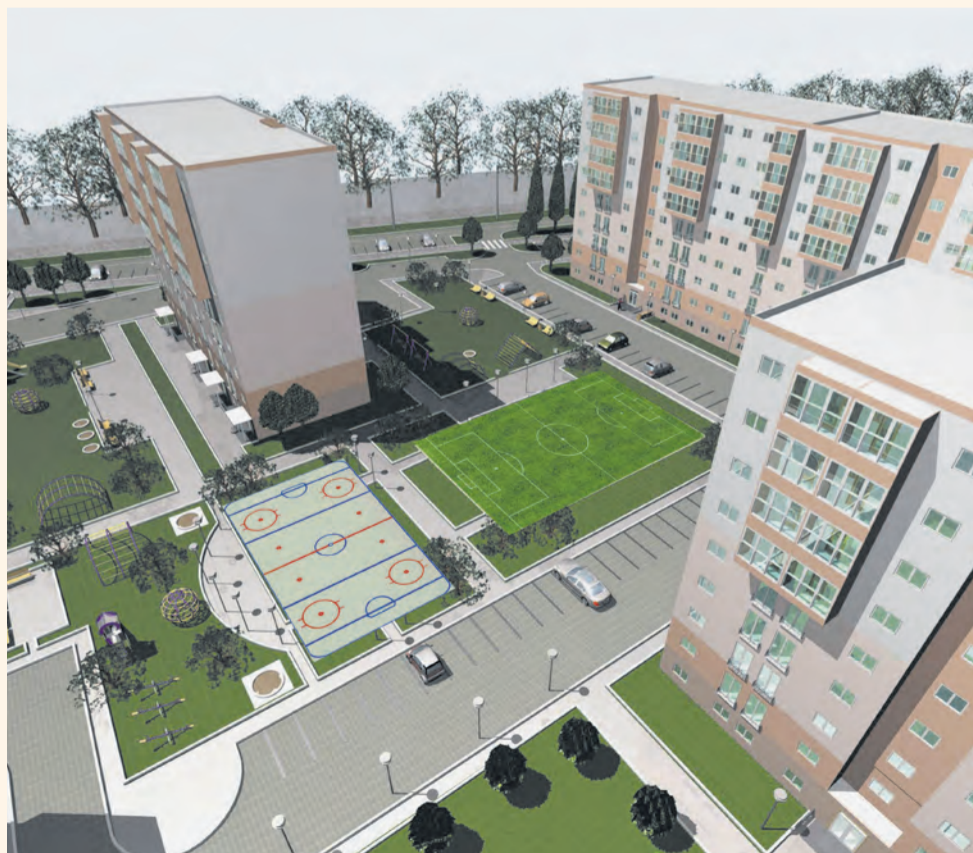
Так должен выглядеть микрорайон Усольский-2...