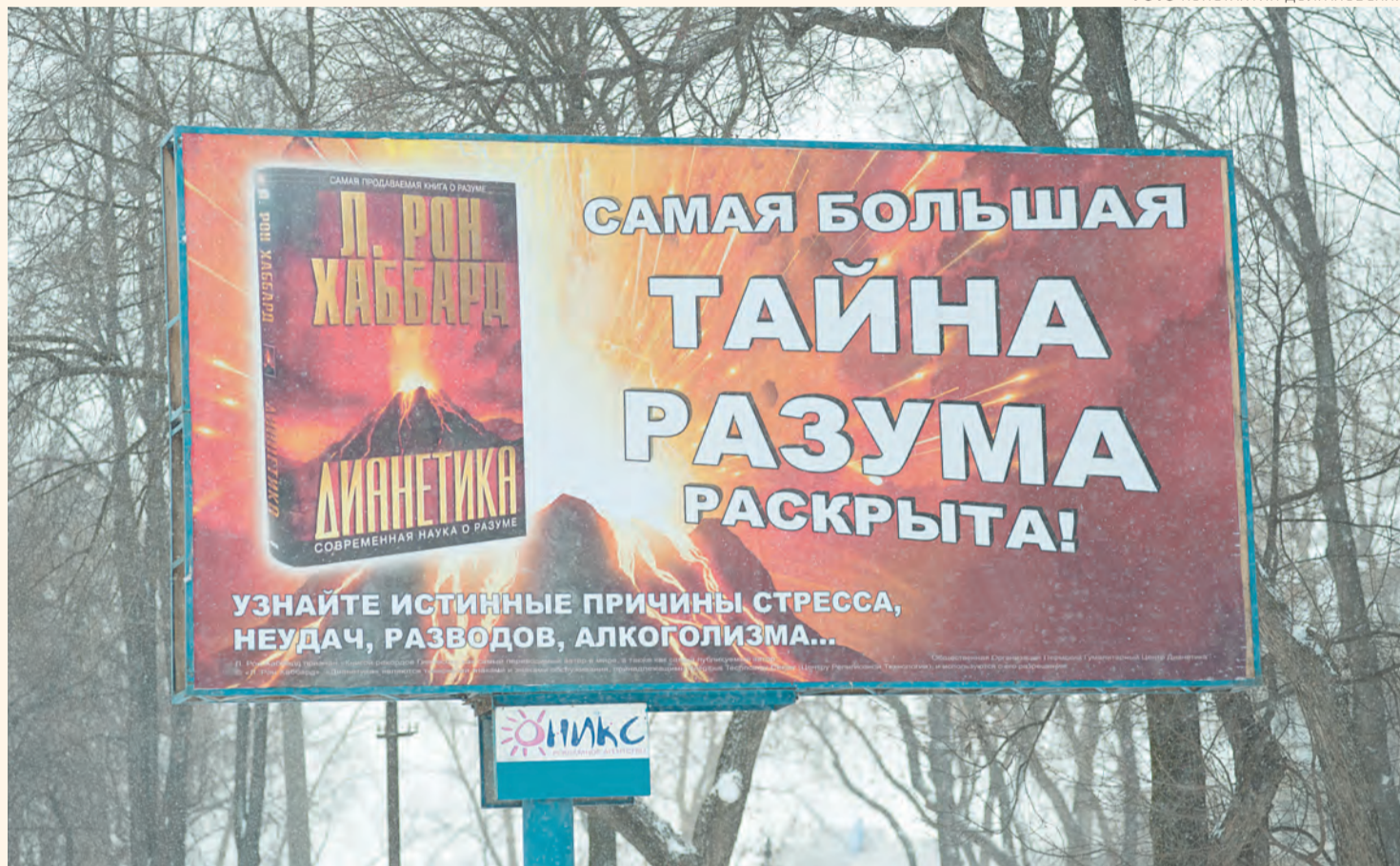
Никуда сторонники религиозной организации, которую многие специалисты считают тоталитарной сектой, из Перми не делись

Пермский край в этом смысле не является исключением. Заметно, что все сколько-нибудь значимые бюджетные закупки последних месяцев проходят без существенного снижения стартовой цены. Времена, когда тот же «Пермдорстрой» мог обвалить цену дороги на Екатеринбург на 1 млрд руб., далеко в прошлом. Самый свежий пример — торги по застройке микрорайона Усольский-2, которые провела специальная комиссия ОАО «Корпорация развития Пермского края» и признала победителем един-