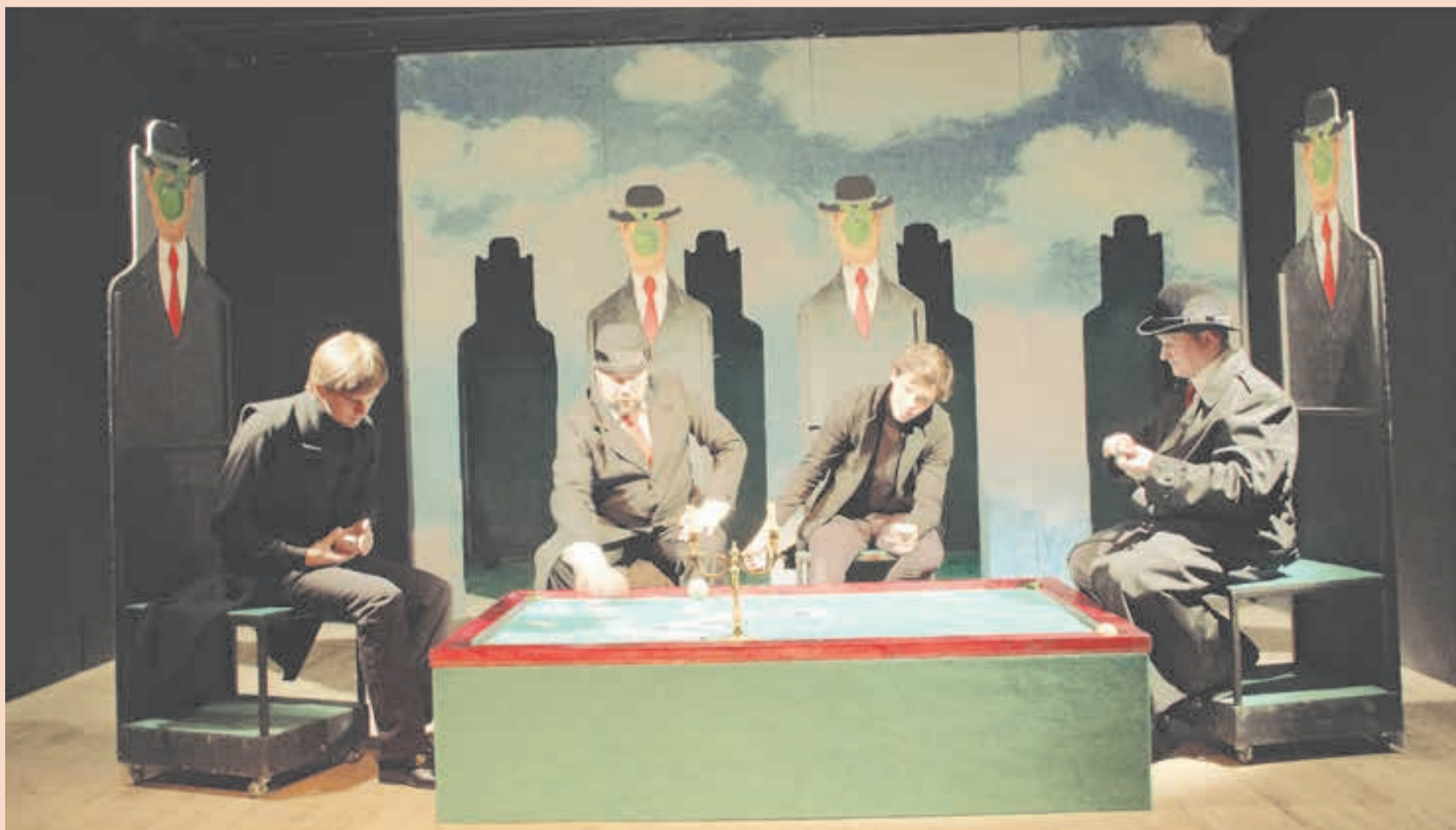
«Вы человек иль демон?» — «Я? Игрок!»