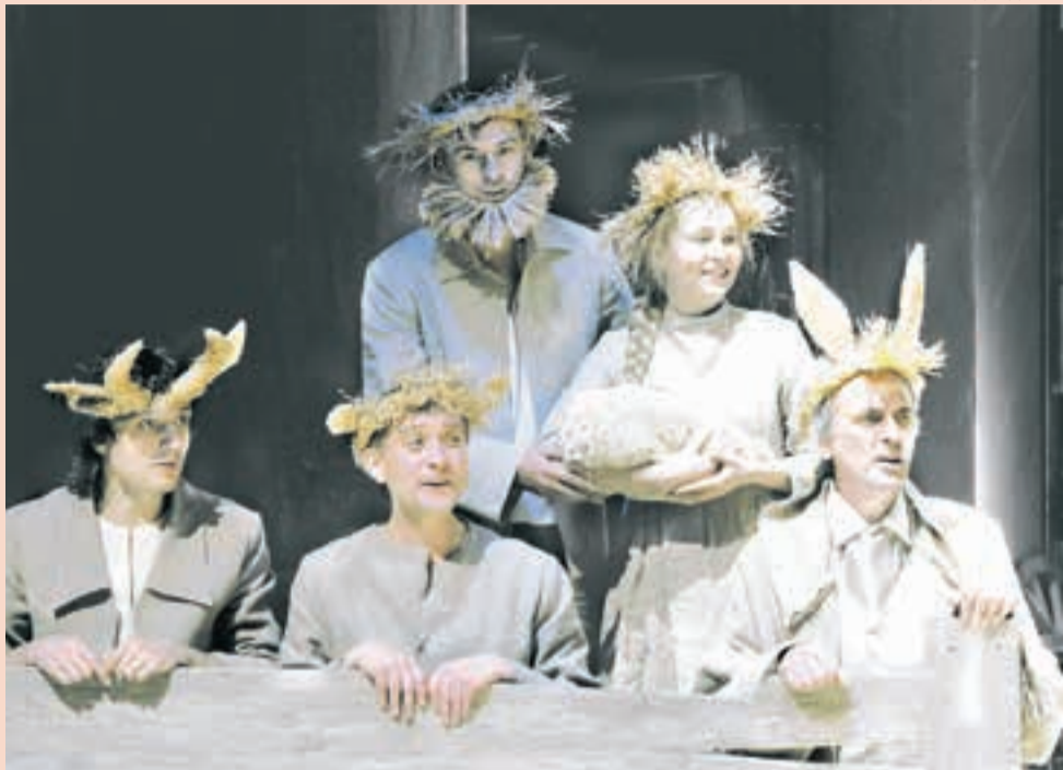
Семья Головлёвых в ожидании чуда