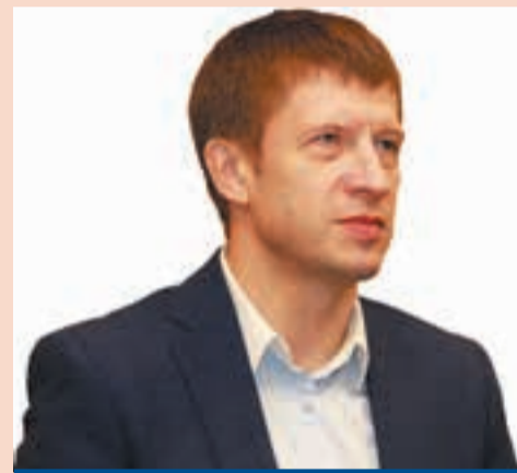
СЕРГЕЙ КЛЕПЦИН, ПРЕДСЕДАТЕЛЬ КОМИТЕТА ПО СОЦИАЛЬНОЙ ПОЛИТИКЕ ЗАКОНОДАТЕЛЬНОГО СОБРАНИЯ ПЕРМСКОГО КРАЯ

Талантливая молодёжь достойна быть отмеченной