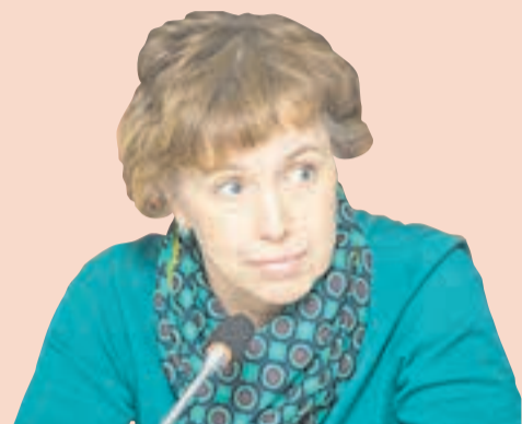
Елена Зырянова, председатель комитета по бюджету Законодательного собрания Пермского края

Семь условий, которые стоит учитывать, рассматривая бюджет Пермского края на ближайшую трёхлетку