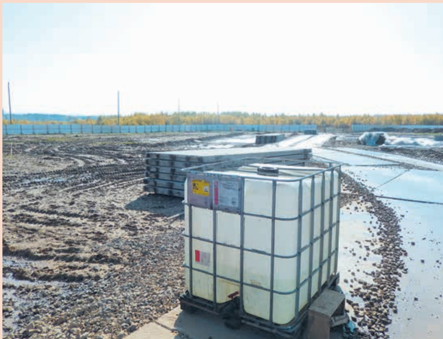
Так выглядело место будущего нового микрорайона месяц назад

В новый микрорайон планируется переселить из левобережной части Березников жителей 99 аварийных домов площадью 247 тыс. кв. м. Инвесторами на паритетных началах выступают ОАО «Уралкалий» и федеральный бюджет. ■