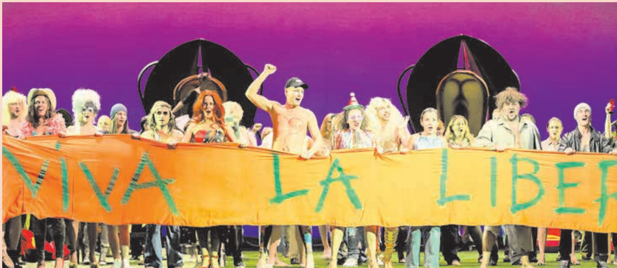
Торжество свободы — недолгое, но яркое