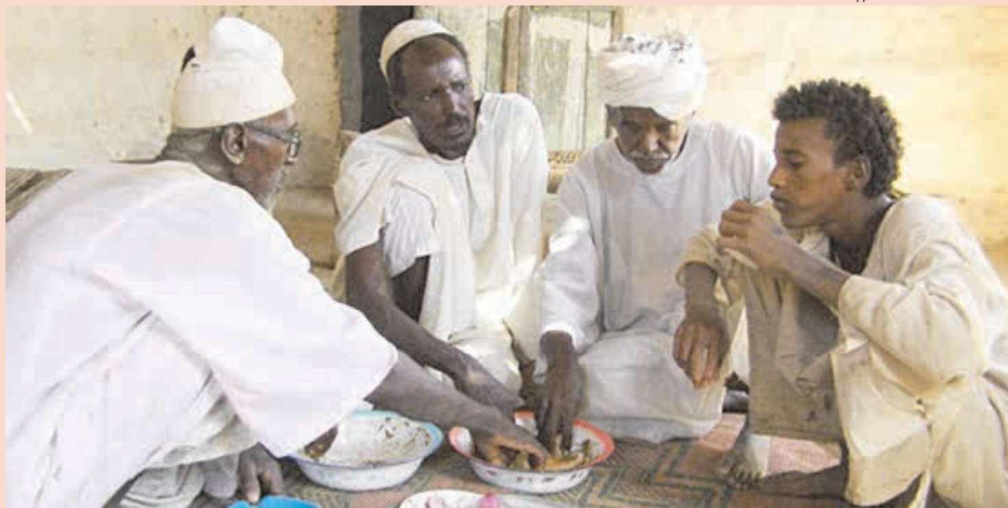
КАДР ИЗ ФИЛЬМА «АБУ-ХАРАЗ»

Заккрытие «Флаэртианы» 28 сентября прошло по-спартански: во временном шатре, выстроенном во дворе киноцентра «Премьер», с маленьким экраном, плохим звуком и вообще без сцены. Ни одно официальное лицо краевого или городского масштаба мероприятие не посетило. Полное впечатление деревенского кино клуба!