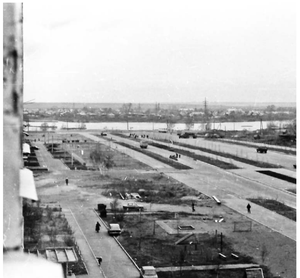
Проспект Парковый, 1970-е