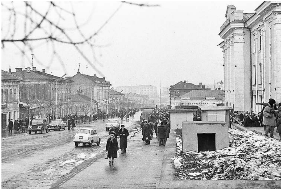
Улица Куйбышева, «Детский мир», 1970-е