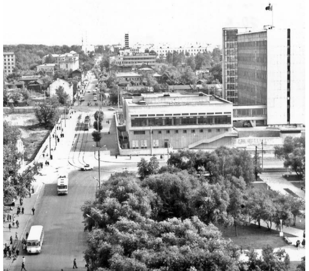
Улица Куйбышева, вид сверху, 1970-е