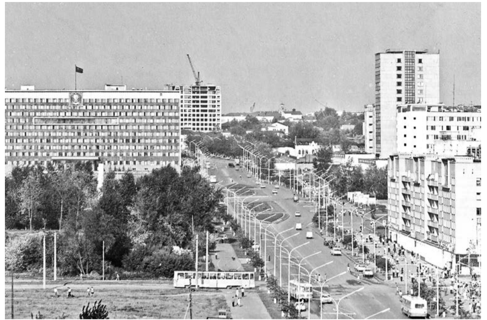
Улица Ленина, 1980-е

Зато во исполнение постановления №545 Пермь успела получить гостиницу «Прикамье», Дворец пионеров (ныне Дворец творчества юных) — пусть и без концертного зала, — драмтеатр и эспланаду. А значит, всё-таки обрела своё новое лицо и стартовые площадки для новых идей и смыслов. Для «Белых ночей», к примеру. ■