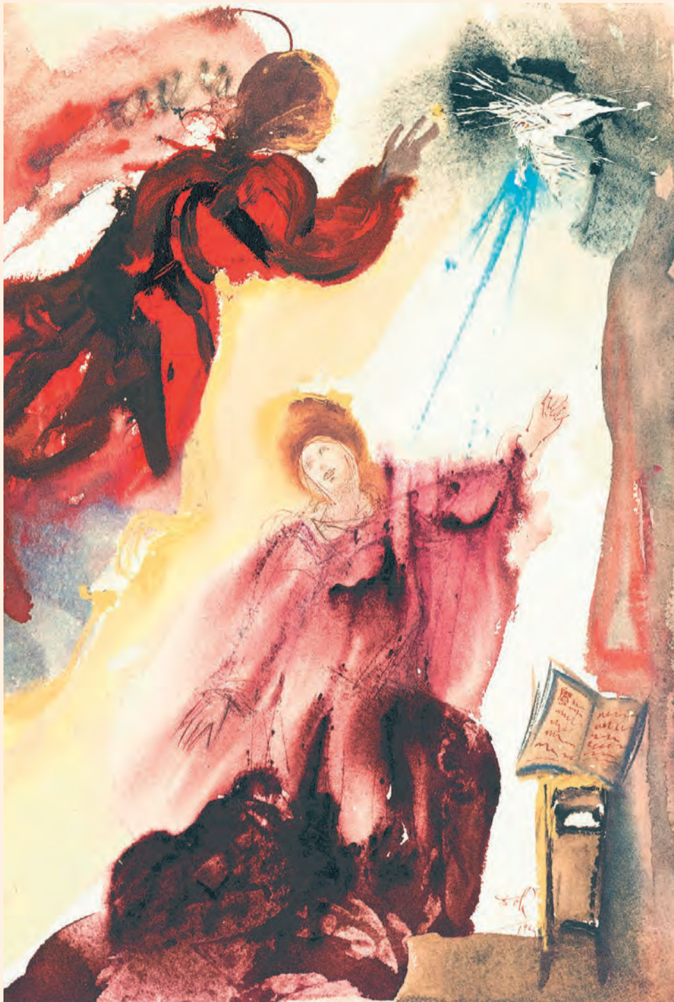
«Ты обрела благодать у Бога»