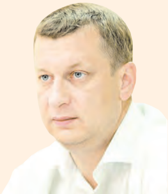
Павел Лях, министр спорта Пермского края

Сейчас заканчивается первое полугодие, и те средства, которые были запланированы в бюджете Пермского края на санно-бобслейную трассу на текущий год, мы уже не успеем освоить. Понимая сложность бюджетного процесса не только в Пермском крае, но и в мировой экономике, в стране, а также с целью более эффективного использования бюджетных средств, принято решение, что деньги, заложенные на санно-бобслейную трассу на 2014 год, мы направили на другие проекты. Но