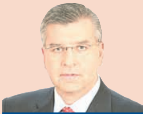
Игорь Сапко, глава Перми, председатель Пермской городской думы

Взаимодействие с общественностью является одним из приоритетных направлений нашей деятельности