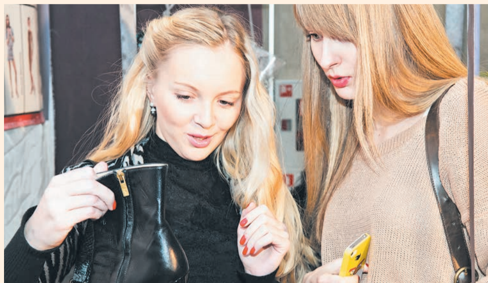
Наибольший выбор на распродаже — в первые дни

«У нас всегда есть новые вещи с этикетками. Каждый год мы выставляем одежду очень достойных брендов, пре-