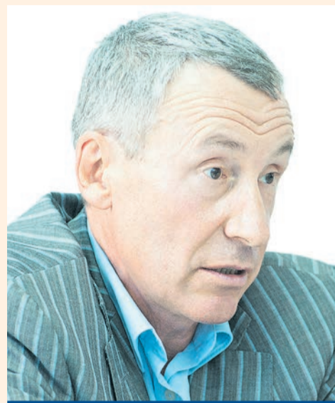
Андрей Климов , член Совета Федерации от Пермского края, доктор экономических наук

Я поддерживал решение, которое разрешает президенту России при необходимости ввести войска на территорию Украины для защиты наших граждан и военной базы ещё до официального рассмотрения этого вопроса в Совете Федерации. За несколько дней до этого у нас было закрытое заседание комитета по международным делам, в который я вхожу. Мы обсуждали возможность такого решения в начале недели, но ситуация потребовала более оперативных действий.