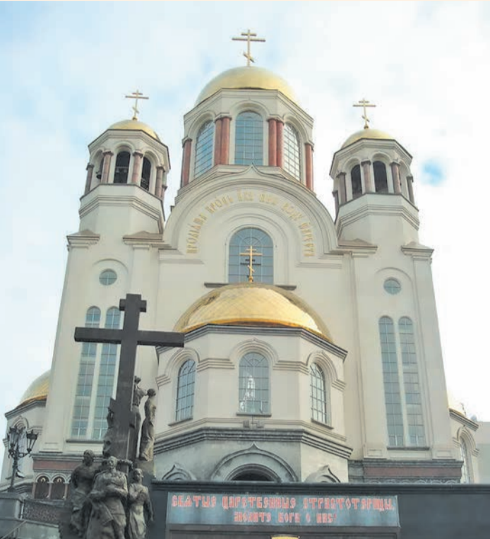
Туристический скородел на месте трагедии — «фарт» подземного суперклада (Храм-на-Крови, Екатеринбург)