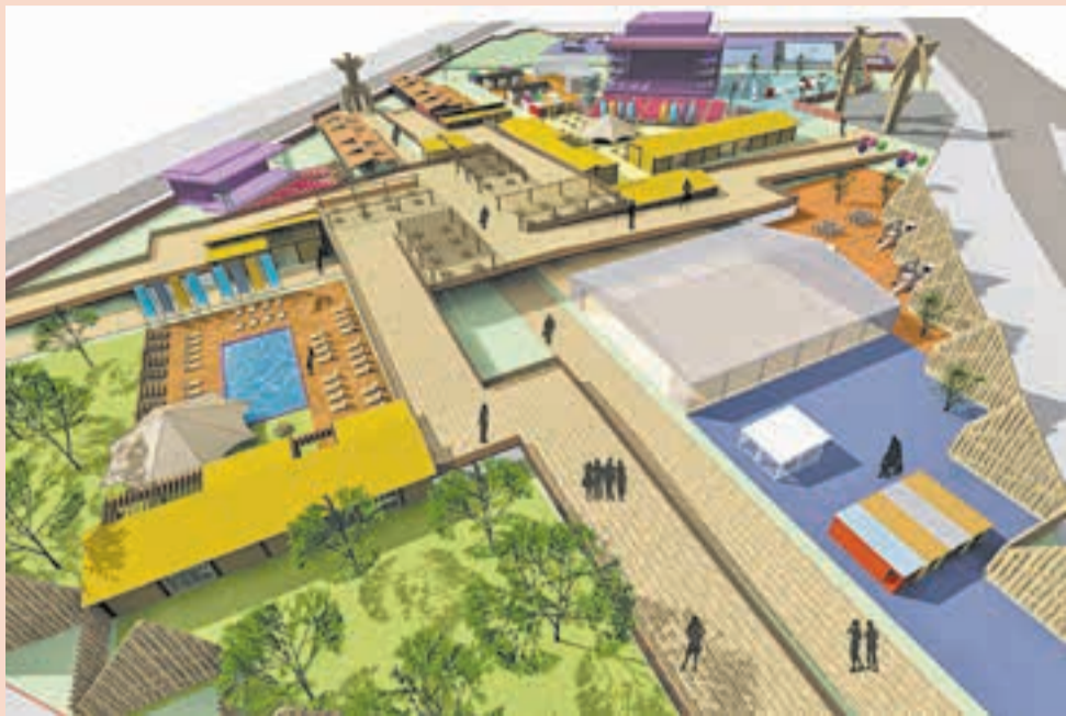
«Экологический городок» от ООО «Озон-дизайн»

Презентация оказалась не готова, а визуального решения фестивального городка не было вообще. Правда, на то были объективные причины: екатеринбуржцы совсем недавно включились в работу, а о необходимости ехать в Пермь с презентацией узнали вообще накануне. Зато у них множество свежих идей, которые ещё не получили хождения в наших краях.