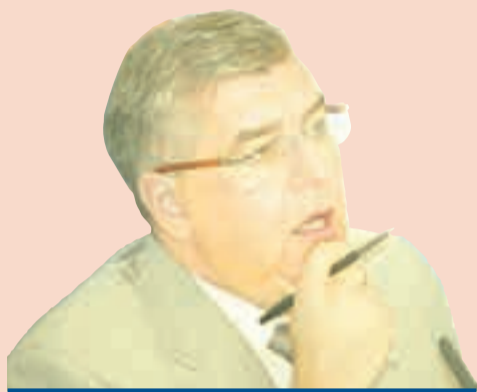
Игорь Сапко, глава Перми, председатель Пермской городской думы

Нам необходимо выстроить систему эффективного взаимодействия между конфессиями, между представителями национальностей и их этнических групп