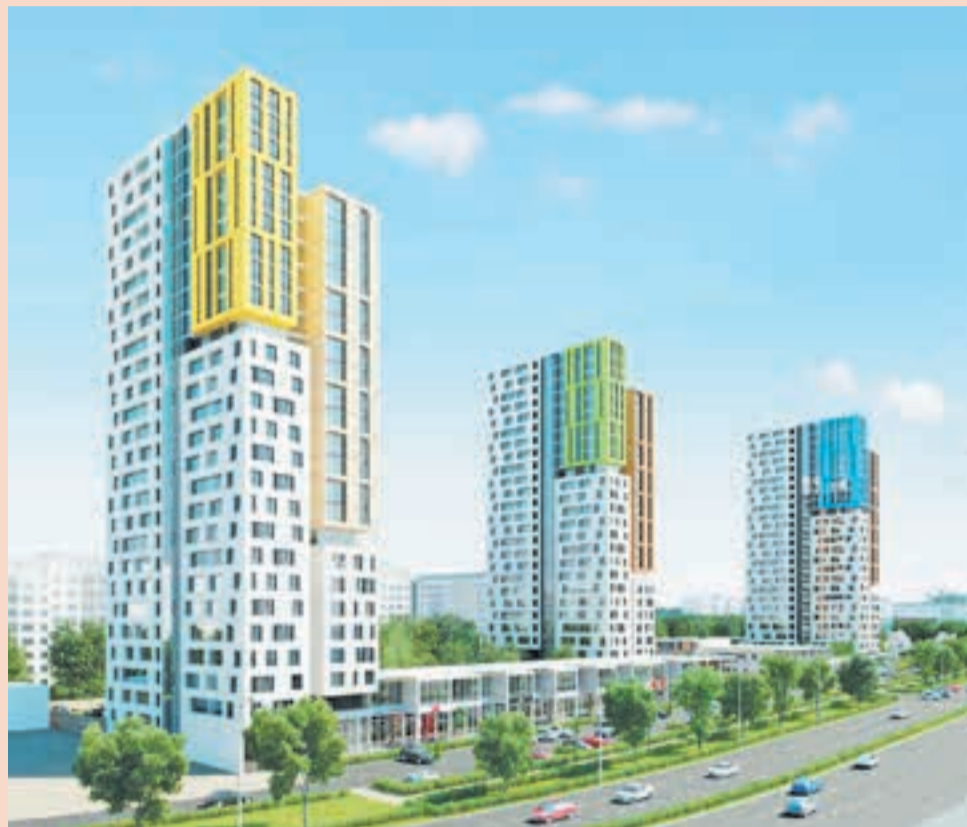
Компания «Талан» планирует открыть на улице Революции в Перми торговый коридор (напротив ЖК «Виктория»)

МФК — это первый проект «Талана» подобного рода. До сегодняшнего дня компания специализировалась на строительстве многоэтажных и коттеджных комплексов.