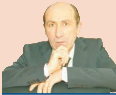
Эмиль Маркварт, президент Европейского клуба экспертов местного самоуправления

Безусловно, и в российском, и в пермском местном самоуправлении всё далеко не идеально. Более того — практически любой человек, мало-мальски знакомый с проблематикой, подтвердит, что ситуация в последние годы существенно ухудшилась. Это касается самых различных аспектов местного самоуправления. Неслучайно в прошлом году было принято решение приступить к разработке концепции развития местного самоуправления в России — эта работа была инициирована экспертным сообществом и поддержана на различных уровнях.