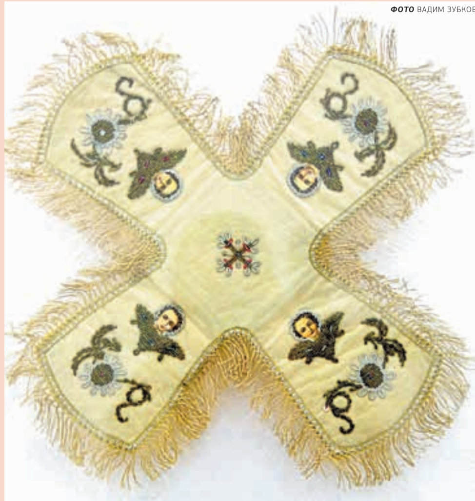
Каждый вышитый покрывец — целая история

P. S. Пример можно довести до абсурда, но от этого он станет более выпуклым. Представим себе «ресторанный центр». Здание, где будут расположены полсотни различных кафе? Немного странно? Фудкорт для города? Однако так тоже бывает. На площади Речного вокзала, среди кучи ресторанов — пополнение. Наконец-то открылась «Экспедиция» — пермско-столичный проект.