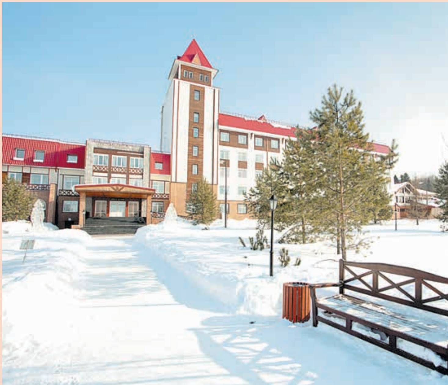
Беспокойные соседи санатория «Демидково» просят $1 млн, после чего обещают прекратить информационные атаки

Собственникам и управленцам следует помнить: помимо ресурсов, необходимых для исполнения бизнес-процедур, сегодня необходимо иметь и ресурсы для ведения судебных тяжб и информационных войн. В Пермском крае фактически на поток поставлены технологии «рейдерства-лайт», или же попросту шантажа. Судебные и контролирующие органы, СМИ и «возмущённая общественность» превращаются в подручные инструменты, которые шантажисты научились легко использовать. ▶ Стр. 21