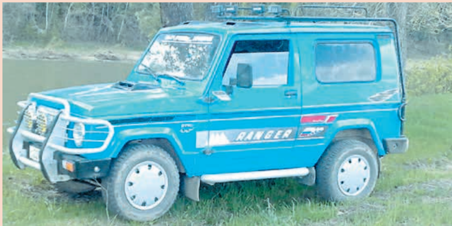
Так выглядел автомобиль пермского производства — «Автокам-Велта Рейнджер»

Призрак «Велты» между тем бродит по микрорайону, бормоча сквозь зубы: «Что плохо началось, то плохо и кончится. Меня обанкротили, и с вами то же самое будет!» ■