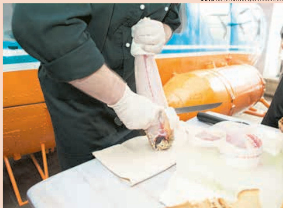
Строганина у борта вертолёта

Колбасу и «масляную рыбу» не ищете. Нежнейший малосольный муксун,