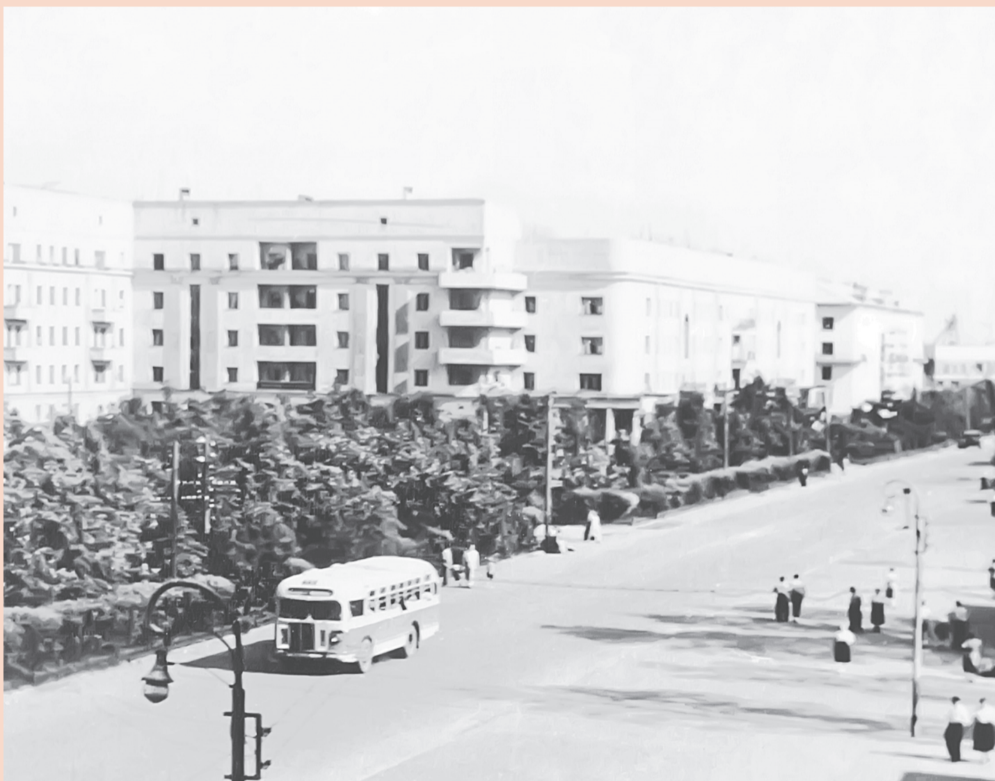
Улица Мира и знаменитый «205-квартирный дом» в 1960-е годы. Почти так же он выглядит и сейчас