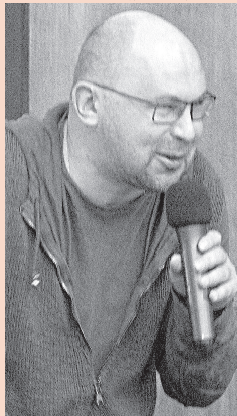
ФОТО ПРОДЮСЕРСКИЙ ЦЕНТР «ИЮЛЬ»

лость. Он этого не хочет, но своей порядочностью не желает превозноситься над окружающими (гордость — как известно, смертный грех). И замещает подлость свинством. Привела его учительница немецкого к себе, он близости с ней не хочет и просто напивается, как свинья. Это, кстати, советский способ существования: когда люди не хотели идти на партсобрания, чтобы там не осуждать кого-нибудь, — просто напивались. С пьяного никакого спросу.