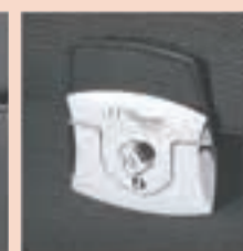
СИЛА ДРАГОЦЕННОГО МЕТАЛЛА