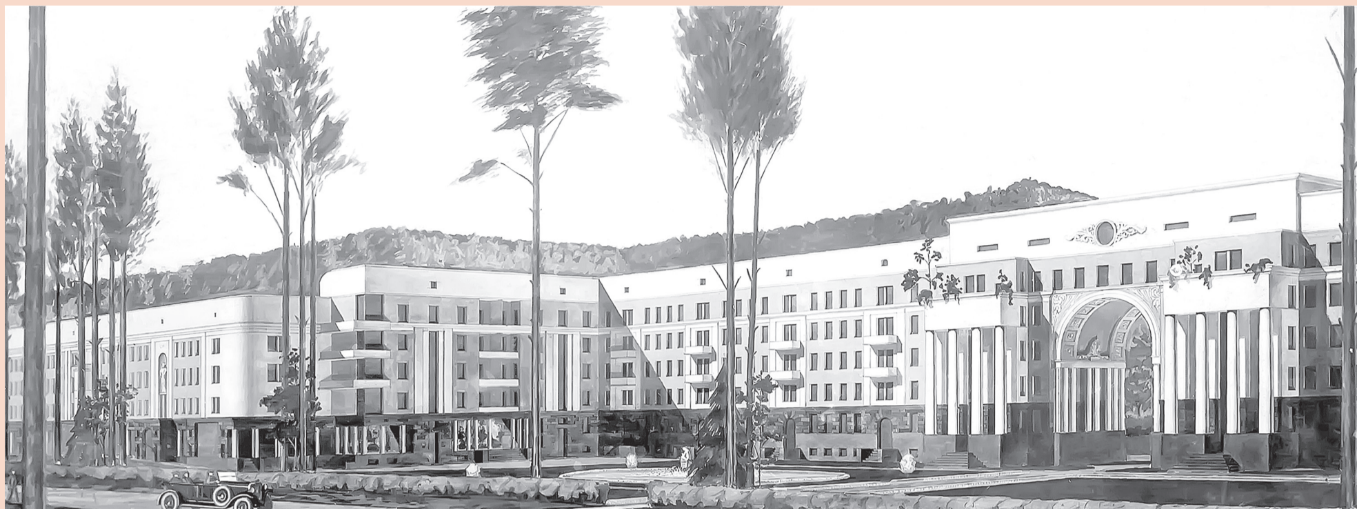
А так «205-квартирный дом» выглядел в проекте

Компанию Мальцевой составила другая активистка — учредитель Фонда поддержки культурных инициатив «Новая коллекция» Надежда Агишева, которая озабочена спасением объектов архитектуры конструктивизма. В настоящее время они вместе добиваются возвращения из частной собственности здания поликлиники на улице Лебедева, находящейся в полуразрушенном состоянии, но ещё пригодной к восстановлению.