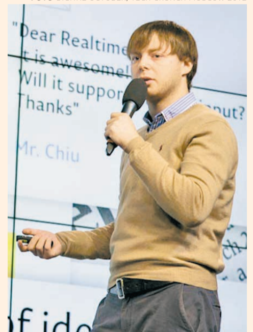
ФОТО DIGITAL OCTOBER, TECH CRUNCH MOSCOW 2012

сервиса в день, сегодня — 700–800. Что изменилось за эту неделю? Какой-нибудь обзор сервиса на YouTube или пост о проекте в фейсбуке собрал большое количество просмотров, и в результате на сайт пришло много нового народа.