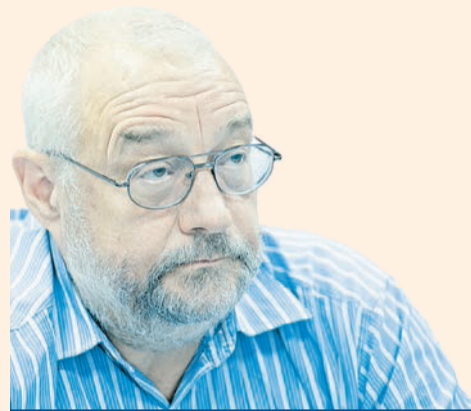
Олег Горюнов, почётный архитектор России

Чтобы претендовать на федеральное финансирование, Пермь должна увеличить объём строительства в 2,5 раза