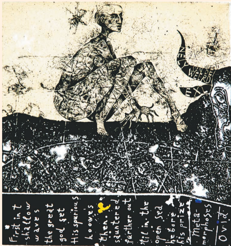
Зуев-2013. «Похищение Европы»

Владимир Зуев — феномен. Он живёт даже не в Перми, а в Нижнем Тагиле, при этом является мировой величиной в одной из сфер изобразительного искусства. Сфера эта специфическая: Зуев — мастер экслибриса. Именно в этом качестве он участвует в международных выставках, которых в его биографии набралось уже более 250. Именно его экслибрисы не просто покупают, а ждут и отслеживают коллекционеры — в очередь буквально записываются. Неудивительно, что в родном городе художник является культовым персонажем — он не только много работает и выставляется, но ещё и является профессором легендарного художественно-графического факультета Нижнетагильской социально-педагогической академии, а также охотно встречается со зрителями, читает публичные лекции и вообще много и хорошо говорит.