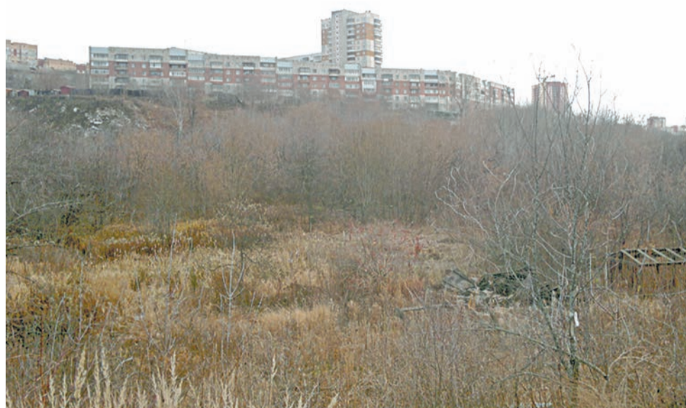
Так выглядит пойма Данилихи сегодня

Создание структурного ландшафтного элемента, который будет формировать границы зелёной зоны и создаст контур, направляющий распространение застройки этой части микрорайона. Кро-