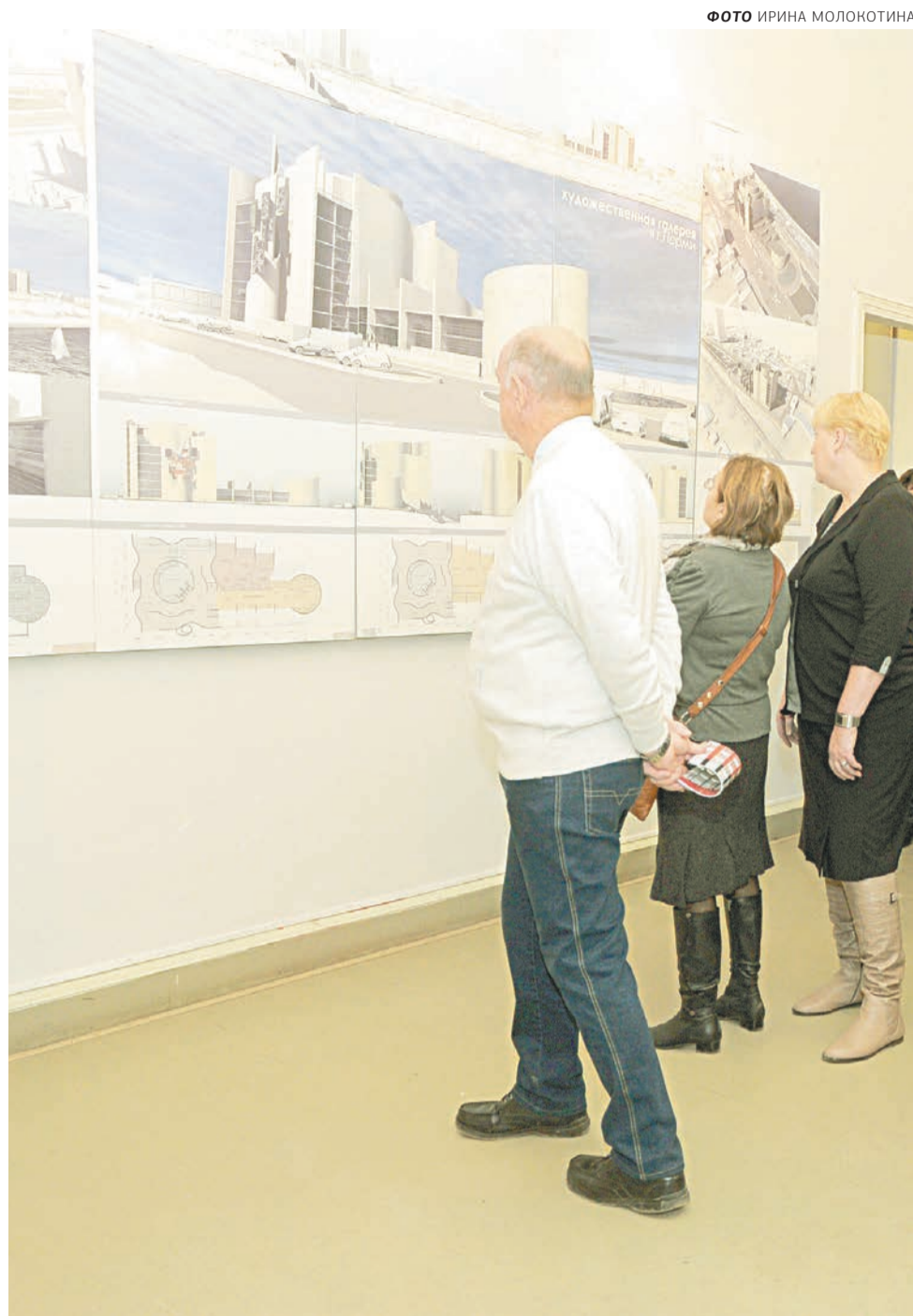
Новое здание Пермской государственной художественной галереи — проект Виктории Щипалкиной

Это относится, например, к проекту нового административного центра в Камской долине — супермногоэтажного здания, которое могло бы стать новым лэндмарком, как уже ставшие знаменитыми «языки пламени» в Баку.