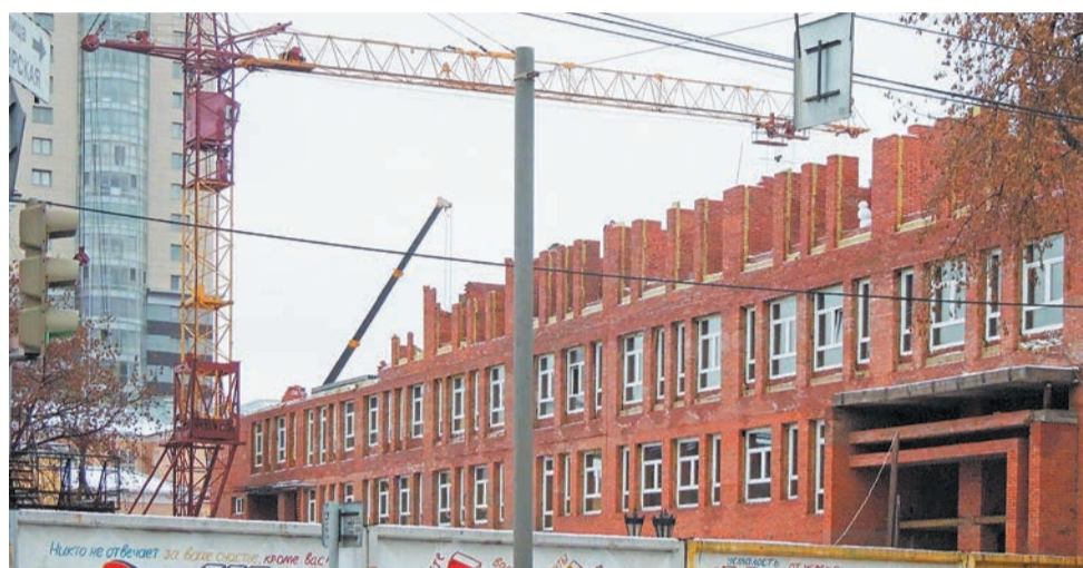
Объект стоимостью 340 млн руб. должен быть сдан в феврале 2015 года

Мэрия вышла на Пермскую сетевую компанию (ПСК) с просьбой срочно провести реконструкцию несущих конструкций подземного канала теплосети, что позволило бы осуществить монтаж крана без угрозы обрушения канала. Однако в ПСК отказались и предложили самостоятельно осуществить временный вынос тепловой сети с обязательным согласованием проекта выноса у тех же сетевиков. К концу октября 2012 года данные работы были