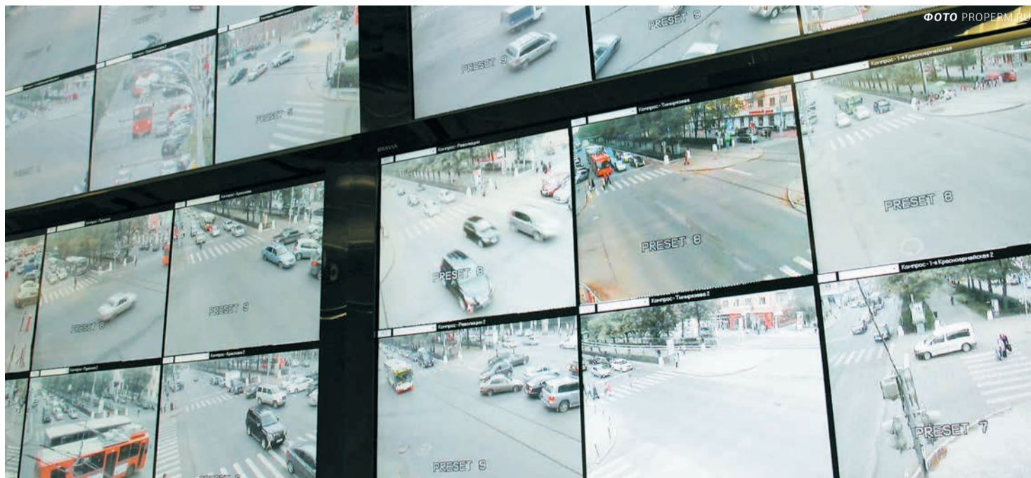
Вся информация с камер стекается в Центр автоматической фиксации административных правонарушений

Так что разработки компаний Вадима Удальёва — пример успешной местной предпринимательской инициативы. Это чисто пермский бизнес, рождённый практически «с нуля». Он вырос на стыке научных разработок и технологий безопасности и получил федеральное значение.