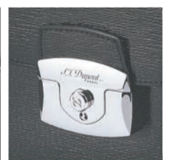
СИЛА ДРАГОЦЕННОГО МЕТАЛЛА